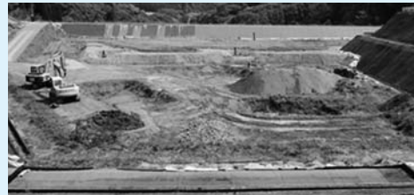
日向市一般廃棄物最終処分場