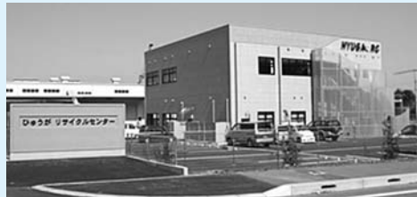
ひゅうがりサイクルセンター