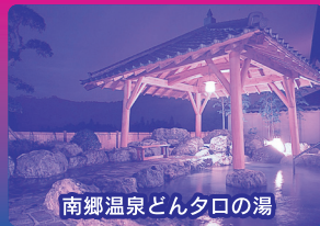
南郷温泉どんタロの湯

特別ゲスト 在日コリアンのサムルノリチーム 歌・舞・楽「パルトカンサン(八道江山)」