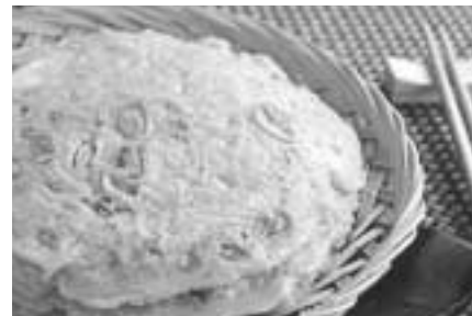
キムチジョン(キムチチヂミ)