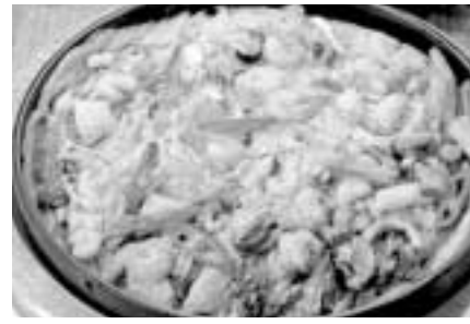
ヘムルバジジョン(海鮮ねぎチヂミ)

『昨年のオータムジャンボ宝くじ(第570回全国自治宝くじ)の効率は、平成22年10月27日(水)です。お忘れなく』