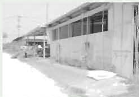
踏み込み消毒槽の設置