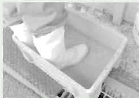
畜舎入口への石灰散布