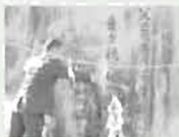
菊田町長による献酒