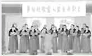
コーラスグループ・コールチェリーナ