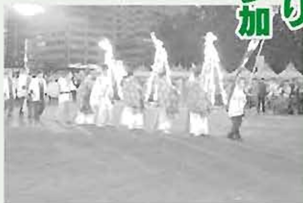
師走祭り：迎え火の場面