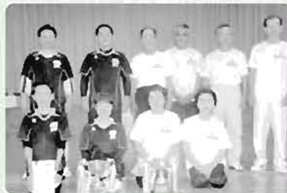
第75回大会優勝チーム

50代 優勝 田代愛好会 チーム 60代 優勝 花水流 チーム 準優勝 とんとんA チーム 3位 かんばいB チーム