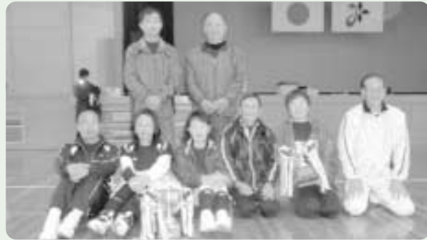
50代 優勝 トントンAチーム

今回の試合で21年度の計画の4回大会全てが終了しました。各理事をはじめ会員の皆様のご協力により、大過なく無事終了できました事に、役員一同お礼申し上げます。 また、22年度大会日程は、3月の代表理事会で決定します。今回の試合結果は次のとおりです。