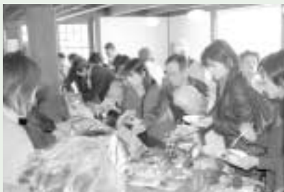
好評!!田舎料理バイキング