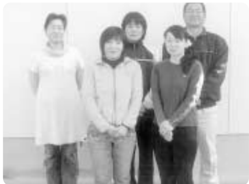
リーグ戦女子大会1位 ウイング