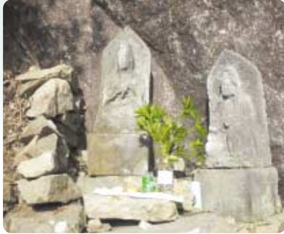
静かに拝観者を迎える観音像

美しい滝とせせらぎ、そして穏やかな観音像は、これから拝観するのに最も良い季節を迎えます。