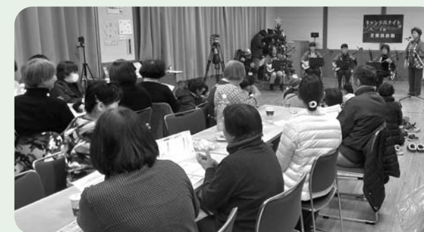
ふれあいミニコンサート