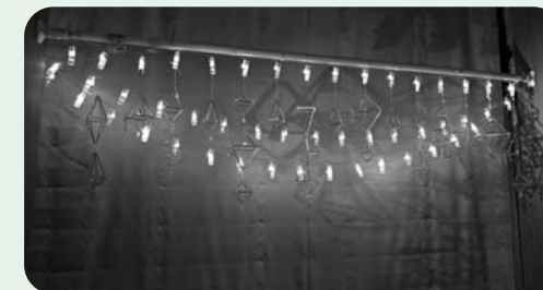
ライトアップされたヒンメリ

開催にあたり、美郷北学園から中学生ボランティアの参加もあり、会場設営から来場者の対応など、各場面で活躍してくれました。町民がひとつになって、とても楽しいひとときを過ごすことができました。