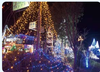
イルミネーションの様子

このイルミネーションは、1月31日(金)まで、毎晩午後5時から午後9時30分に点灯していますので、ご家族やお友達などお誘い合わせの上、是非ご来場ください。