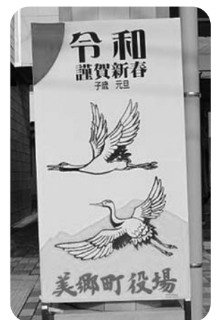
イケダ画房様より寄贈いただいた看板