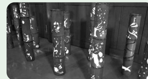
図書館を彩る竹灯籠