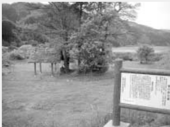
塚の原古墳(南郷区)