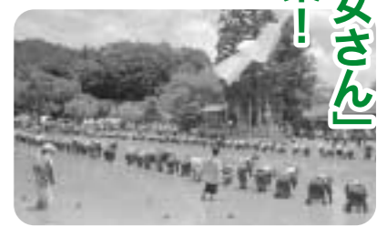
早乙女による田植え

「早乙女さん」大募集! 「御田祭」早乙女の一般参加者を募集いたします。 募集の対象は、町内外を問わず、中学生以上の女性を募集いたします。当日は、早乙女衣装に着替えていただき、中の宮田での田植えに参加します。 参加を希望される方は、6月20日(金)までに西郷支所地域政策課 (☎0982-66-3609)へお申し込みください。 是非、伝統ある御田祭にご参加ください。たくさんのご参加をお待ちしております。