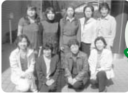
美郷町母子保健推進員の皆さんです!

母子保健推進員さんには、主に地域の方々の妊娠・出産・育児に関する情報提供・相談や乳幼児健診時のお手伝いをしていただいています。情報提供や相談という堅苦しい印象を受けるかもしれませんが、みなさん子供が大好きで、地域で赤ちゃんと育つことをご自分の家族のように楽しみにされている方たちばかりです。お散歩中や買い物するときでも、もし見かけたときには声をかけてみてください。皆さん素敵なお母さん、おばあちゃんとして活躍されている方たちなので、どんな些細な悩みでも親身になって応援してくれます。 これからも母子保健推進員の皆さんをよろしくお願います。