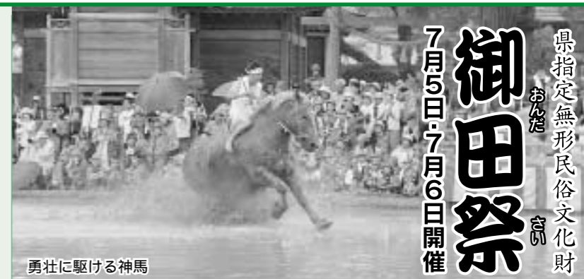
勇壮に駆ける神馬