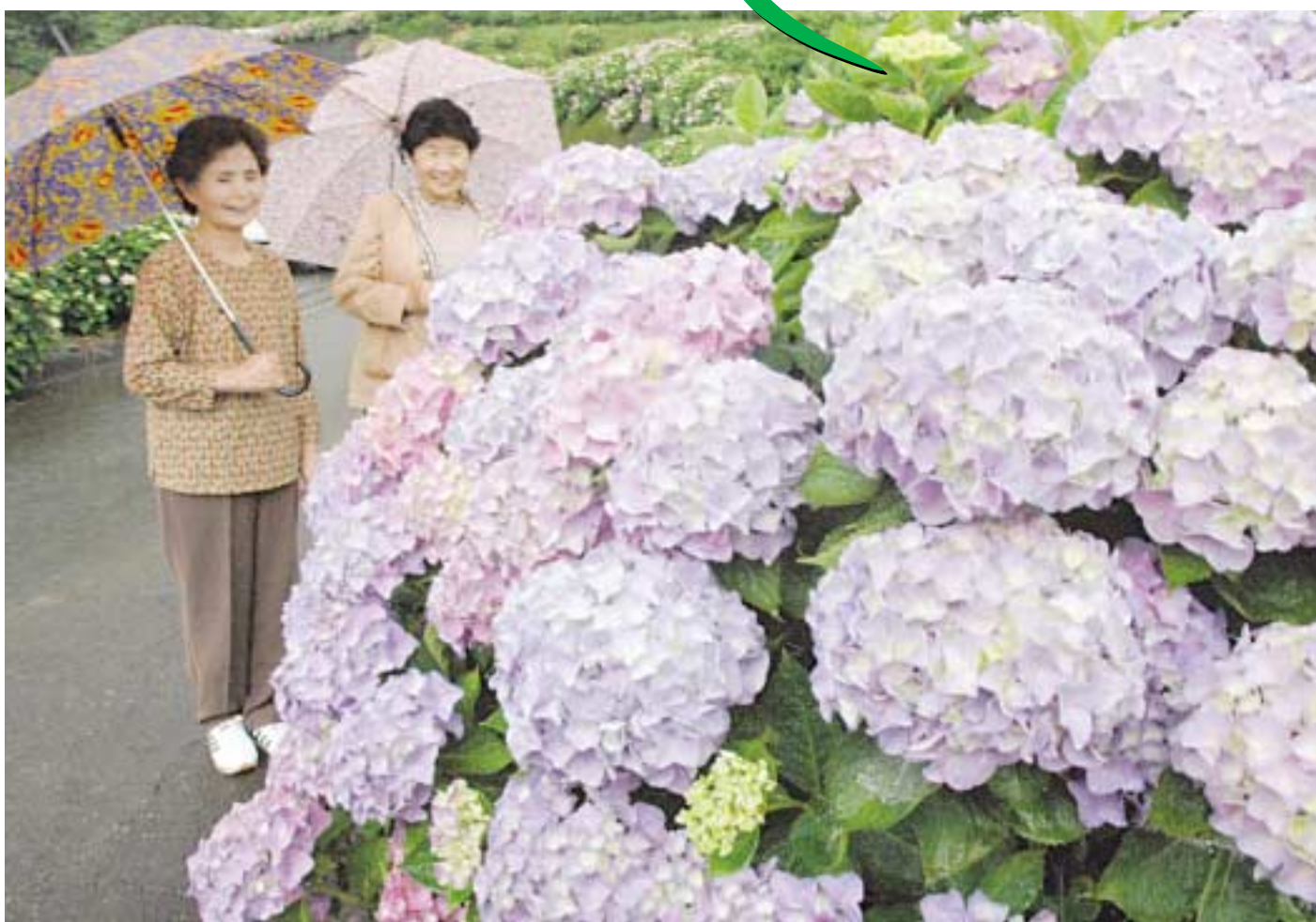
あじさいロード(写真は昨年の様子)