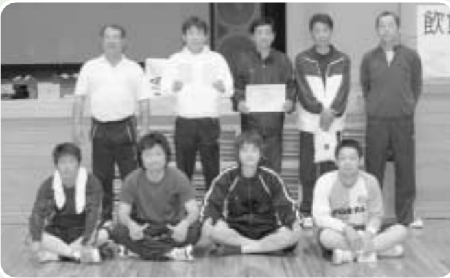
1部リーグ優勝 速日バレークラブ