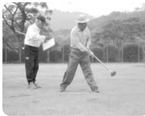
西郷区・グラウンドゴルフ