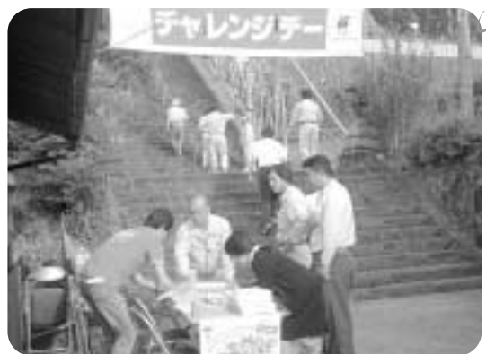
北郷区・全長寺階段上り