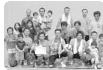
男子の部優勝 若宮フィーバー

どちらのチームも若宮地区を中心とするメンバーで編成されており、見事アベック優勝を成し遂げました。