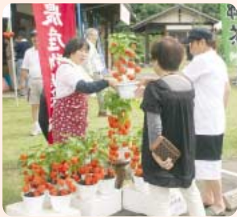
昨年の「ほおずき祭」のようす