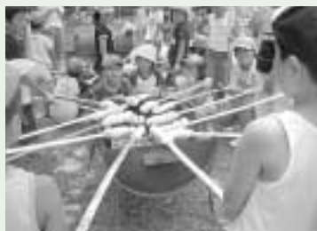
昨年のバンづくりの様子