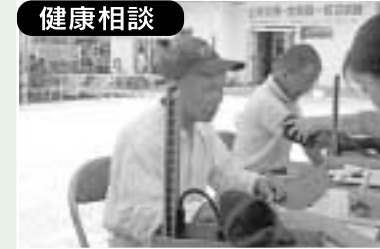
健康相談 臨時の健康相談