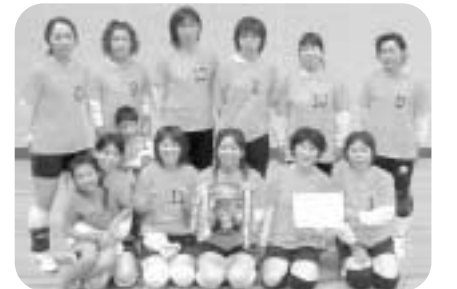
女子の部優勝 オレンジ