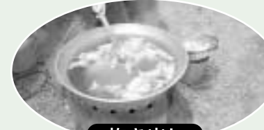
炊き出し ハイゼックスを使った炊き出し

その後、日赤ボランティアによる炊き出し訓練や救急蘇生講習会、保健士による健康診断や防災教育ビデオ上映等がありました。参加者の皆さんは、ハイゼックス炊飯袋を使用した炊き出しやAED(自動体外式除細動器)の使用方法等に興味深げに見入っていました。 これからの季節、大雨や台風による災害の発生が予想されます。防災は日頃からの心がけが大切です。一度近くの避難所への避難方法や経路等について、考えてみてはいかがでしょうか。