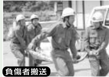
負傷者搬送 竹と毛布の臨時担架での緊急搬送

6月1日(日)に、神門下区(上名木・下名木・黒岩山麦・吾渡)を対象に、「土砂災害・全国統一防災訓練」が行われました。 近年、台風や集中豪雨により全国各地で毎年約1,000件の土砂災害が発生し、多くの犠牲者が発生しています。 土砂災害に対する警戒避難体制の整備を図ることを目的に、地域住民、町、県、国、防災関係機関による、土砂災害・全国統一防災訓練が全国的に実施され、今回初めて美郷町南郷区で実施されました。 当日は、大雨により土砂災害の危険性が高まったとの想定で、避難勧告を発令し、3部及び本部長の誘導により下区集会センターまで住民の方の避難訓練を行いました。途中、負傷者が発生したとの想定で、臨時の担架による搬送後、救急搬送車による移送も行われました。