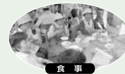
食事 訓練後は炊き出しでの食事です