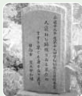
昨年度第19回最優秀賞の作品

未発表作品(3首連記) テーマは自由 官製葉書による 住所・氏名・電話番号を葉書の表に明記のこと 【募集期間】 9月1日(月)締切(当日消印有効)