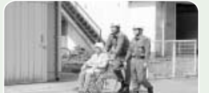
消防団員の避難誘導