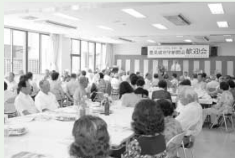
同窓生90名による歓迎会

姉妹都市盟約更新事業が行われ、その際にぜひ思い出の地北郷を巡りたいという宇納間会の希望により今回の訪問が実現しました。当日は、思い出の北郷小学校を訪問し、北郷での戦時中の思い出などを話され、子どもたちは熱心に聞き入っていました。また、北郷尋常高等小学校開校記念の日の歌