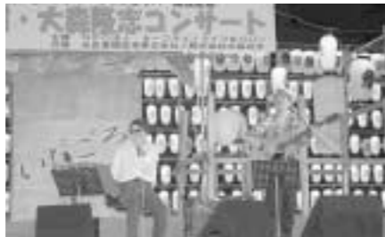
観客を魅了したコンサート