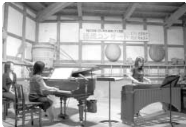
平成19年5月26日開催 酒蔵コンサートの様子

昨年、大きな反響を呼んだ「酒蔵コンサート」が今年は「ミュージックギフトin美郷」と題して、開催されます。