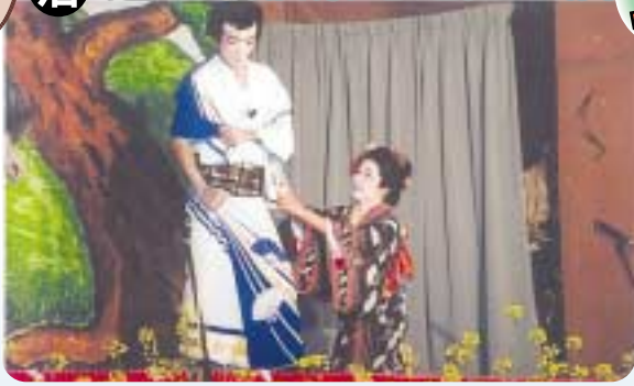
平成13年開催「菜の花祭り」

以前「菜の花祭り」として行われていた地芝居が今年「速日収穫祭地芝居公演」として復活します。屋外の舞台では地芝居、歌や踊りと多彩な催しで公演を盛り上げます。