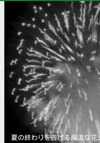
夏の終わりを告げる風流な花火