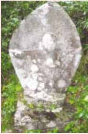
「珍しいお地蔵様です」

左手におにぎり、右手で道案内。とってもユーモアのあるお地蔵さんです。この案内地蔵のおかげで迷う人もなくなり、安心して宇納間地蔵参りができたといえます。