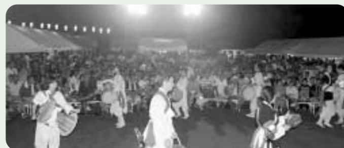
サムルノリ:大分立命館アジア太平洋大学の留学生の皆さん