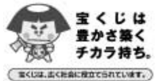
宝くじは豊かさ築くチカラ持ち。宝くじは、広く社会に還元されています。