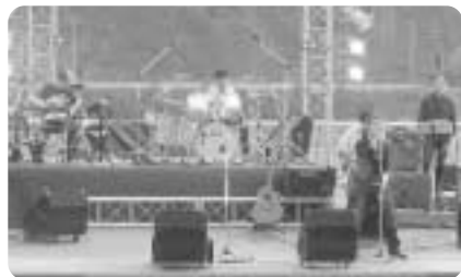
昨年の音楽祭の様子