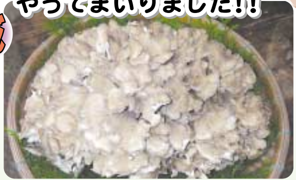
3キロ近いジャンボマイタケ

今年も南郷区渡川地区で栽培されております「原木マイタケ」が収穫の時期を迎えようとしております。試験栽培から数えて丸6年、3年前から本格的な出荷を開始し、ようやく渡川地区の特産として定着してきました。9月下旬から10月中旬までの約3週間しか味わうことのできない貴重なきのこ、より自然に近い状態で栽培するため、味や匂いに独特の風味が感じられます。期間中は注文販売のほか、区内販売所「いっつもや」やJA日向管内の「八菜館」などでも販売を予定しております。天ぷら、すき焼き、炊き込みご飯など色んな料理にもピッタリです。皆さんも是非、原木栽培ならではの「風味、歯ごたえ」をご賞味下さい。