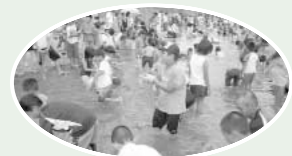
大人も子供もおおはしゃぎ