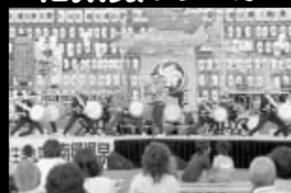
宮崎が誇る和太鼓集団! 橘太鼓(宮崎響座)