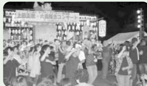
参加者全員で賑わった「いだごる踊り」