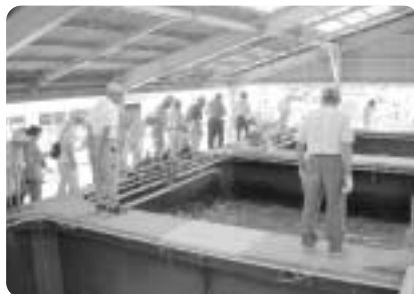
稚魚を飼育する大水槽

今年度2回目の全寿大学として、9月9日(火)、延岡市北浦にある宮崎県水産振興協会の施設を見学しました。