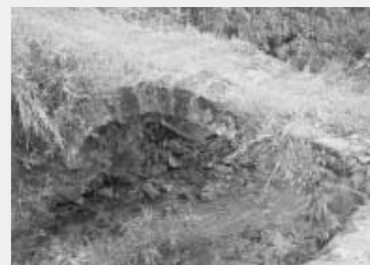
名橋 水清谷眼鏡橋

南郷区水清谷樋の元地区に架かる水清谷眼鏡橋は、明治33年頃の架設で、熊本形式の架橋といわれています。昭和9年に現在の道路ができてからは、基幹道路としていかなる重量を通すとも、また、いかなる大洪水にも微動だにできなかったといわれる名橋です。 〔南郷区〕