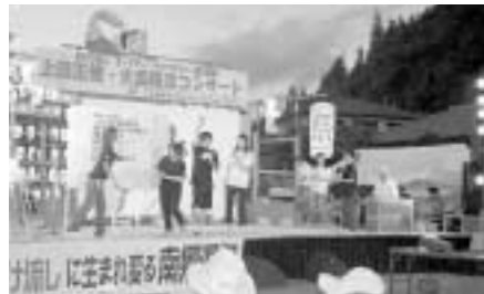
お楽しみ抽選会の様子