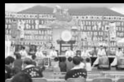
和太鼓の魅力に魅かれて! 秋月鼓動(高鍋町)