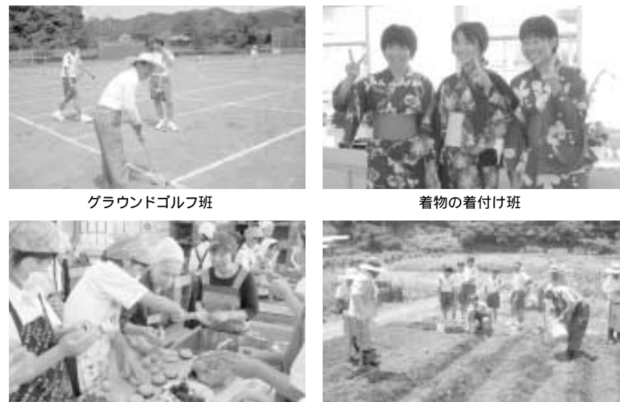
グラウンドゴルフ班

7月11日(金)に西郷区の全寿会40名の皆さんを西郷中学校に招待してふれあい交流活動が行われました。「ふれあい交流活動」では、郷土料理班・着物の着付け班・グラウンドゴルフ班・作物栽培班の4つの班に分かれて全寿会の皆さんと生徒とのふれあいを深めました。