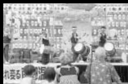
日向地域を盛り上げようと結成! 十五夜太鼓(日向市)