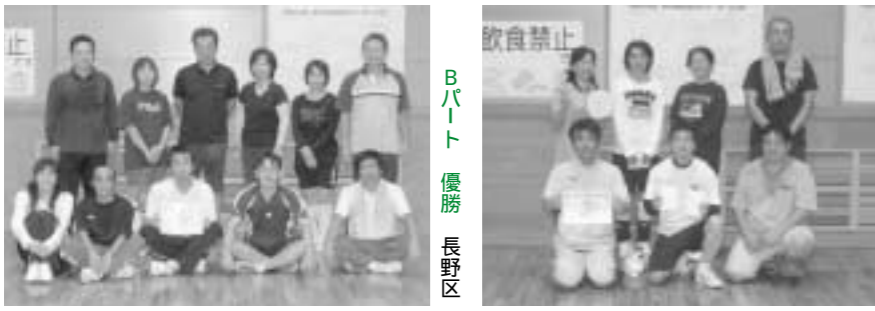
Aパート 優勝 黒木区