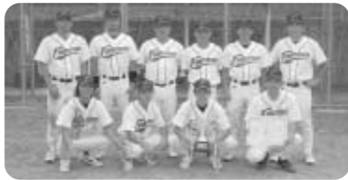
優勝 秋盛フロンティア

平成20年度北郷区野球リーグ戦(8月18日〜10月1日)が開催され、いずれ劣らぬ熱戦が繰り広げられました。リーグ戦は6チームで行い、秋盛フロンティアが4勝1敗と安定した力で見事熱戦を制し、優勝を果たしました。リーグ戦の結果及び個人賞は次のとおりです。