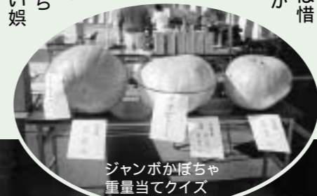
ジャンボかぼちゃ重量当てクイズ

北郷区では近年、公民館や地元有志による地芝居復活公演が催されており、今回も20代から50代の速日公民館員を中心に、3カ月前から練習に励んできました。戦後から生活になじんだ根強い娯