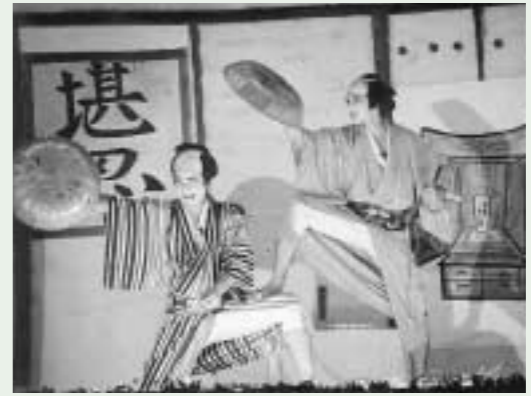
任侠芝居「男 松竹梅」

楽のひとつとしてその歴史がある北郷区の地芝居。これからも地域の皆さんによる自作自演の娯楽芸能の継承を願って止みません。