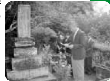
平成20年10月7日 葉桜墓参「墓前報告」