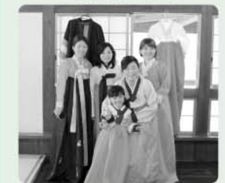
チマチヨゴリ(韓服)試着体験