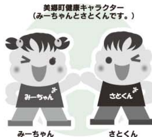
美郷町健康キャラクター (みーちゃんとさとくんです。)