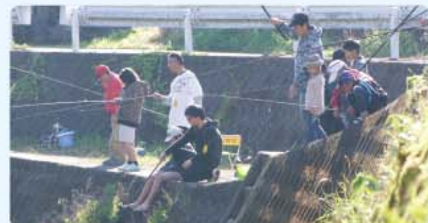
大人も子供も楽しんでいます