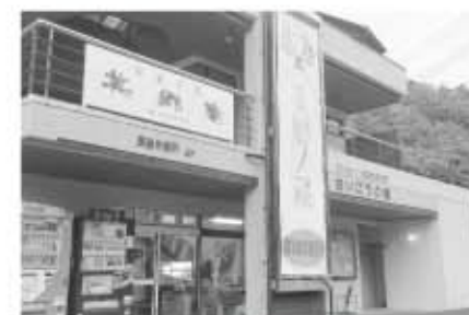
さいごうの関店の様子

現在、宮崎駅の構内と今回の美郷庵、そして、移動販売車でイベント会場などでの販売を行っており、イベント会場や都農・宮崎・そして美郷と飛び回っております。仕事に熱中して頑張っています。