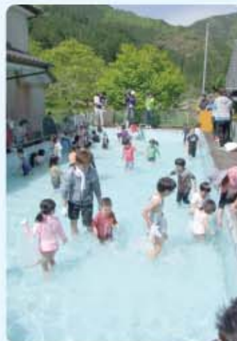
プールではつかみ取りもありました

4月26日(日)に北郷小原地区の五十鈴川で恒例の「ヤマメ釣り大会」が春空の中盛大に開催されました。 豊かな自然と五十鈴川の清流に親しんでもらおうと、北郷商工会青年部が毎年開催しており、今回で18回目を迎えました。 町内外より大人から子供まで、約140名が参加し、福岡・熊本県等九州各地からも太公望が集まりました。特に今回は他のイベントと日程が重なりましたが、参加者数は大きくは衰えず、大いに賑わいました。 今年はヤマメのサイズが大きめで、よく釣れている参加者となかなか釣れず苦労している参加者とがいたようです。参加した子供たちは、親や友達に教わりながら、釣りやつかみ取り大会を楽しんでいました。 大会終了後は、参加者にヤマメの塩焼きが振る舞われ、初夏ともいえるような暑い日差しの中、家族揃っての休日を楽しんでいました。 いつの時代になっても、「清流・五十鈴川」と胸を張って言えるよう、住民みんなで美しい環境の保全に努めていきたいと思います。