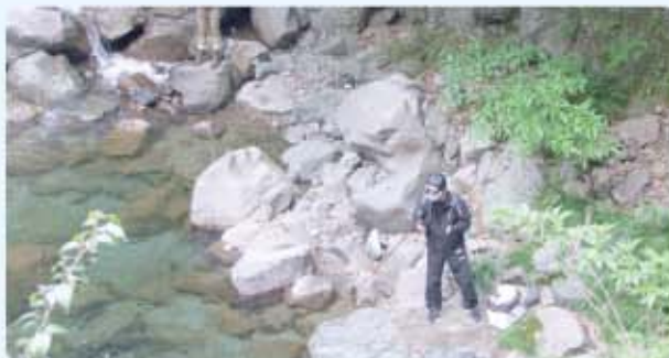
上流で大物を狙っています

4月26日(日)に北郷小原地区の五十鈴川で恒例の「ヤマメ釣り大会」が春空の中盛大に開催されました。 豊かな自然と五十鈴川の清流に親しんでもらおうと、北郷商工会青年部が毎年開催しており、今回で18回目を迎えました。 町内外より大人から子供まで、約140名が参加し、福岡・熊本県等九州各地からも太公望が集まりました。特に今回は他のイベントと日程が重なりましたが、参加者数は大きくは衰えず、大いに賑わいました。 今年はヤマメのサイズが大きめで、よく釣れている参加者となかなか釣れず苦労している参加者とがいたようです。参加した子供たちは、親や友達に教わりながら、釣りやつかみ取り大会を楽しんでいました。 大会終了後は、参加者にヤマメの塩焼きが振る舞われ、初夏ともいえるような暑い日差しの中、家族揃っての休日を楽しんでいました。 いつの時代になっても、「清流・五十鈴川」と胸を張って言えるよう、住民みんなで美しい環境の保全に努めていきたいと思います。