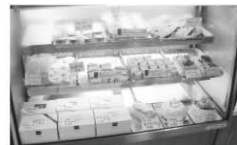
ショーケースにはたくさんの洋菓子・和菓子が並べられています。