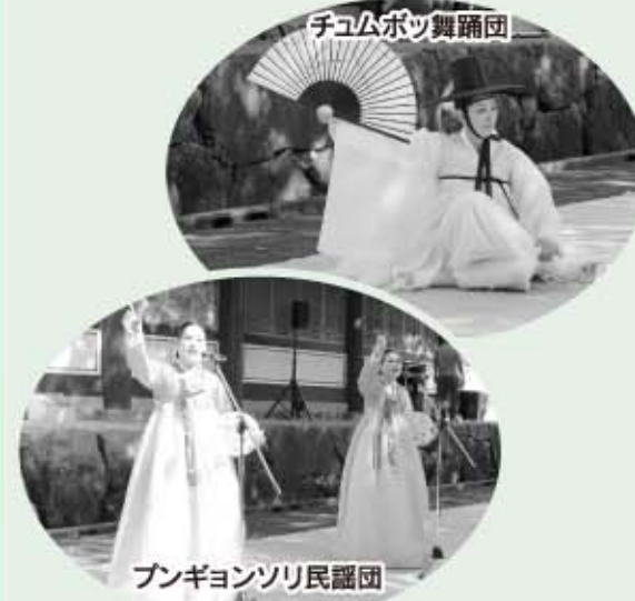
チュムボツ舞踊団

4日(月)は、引き続き「ナムサダン」によるサムルノリの公演が行われ、さらには大分から来られた日本文理大学と立命館アジア太平洋大学の学生によるサムルノリの公演も行われました。韓国からは「ブンギョソリ民謡団」と「チュムボツ舞踊団」が来町され、明るく軽快な京畿地方の民謡や、ストーリー性のある舞踊劇、伝統的な舞踊などが披露されました。韓国の伝統芸能をご覧になった来場者の中には、韓国に行った気分になったという方もいたようです。神門神社境内では、日向市茶道連盟の協力による新緑のお茶会(野点)も開催され、ゴールデンウィークの賑わいの中にゆったりとした時間が流れていました。