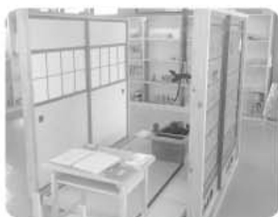
もっくわーく那須