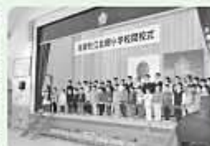
北郷小全児童発表

それぞれの学校の閉校式に参加された皆さんは記憶をたどりながら学校を偲んでいました。2校の小学校の歴史と伝統は新しく開校する「美郷北学園」に受け継がれ、新たな歴史を築いてくれることを期待したいと思います。