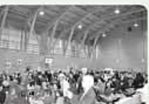
黒木小惜しむ会での参加者