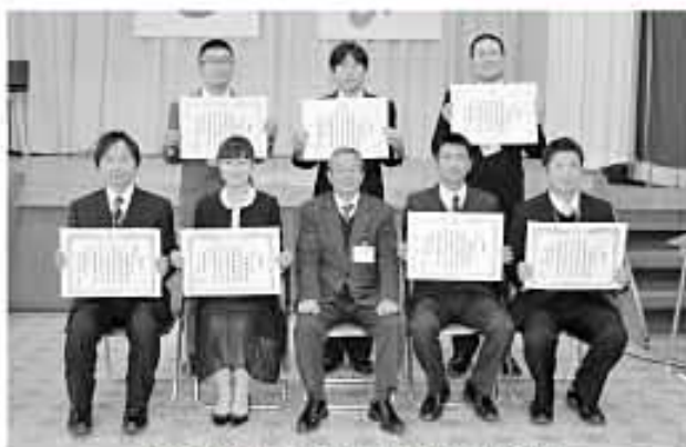
教育論文1, 2, 3席、奨励賞の入賞者

2月26日(木)本年度の教職員教育研究論文表彰式を行いました。美郷町では、毎年、教職員を対象に教育研究論文を募集しており、今年も25編もの応募がありました。いずれも教育的課題解決のために工夫改善を重ねた素晴らしい内容ばかりでした。同日、本年度の美郷町教育研究所による「美郷科」の研究発表も行われました。これらの研究成果が美郷町のさらなる教育力向上につながるものと思われれます。