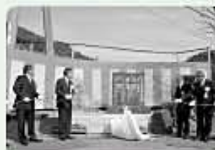
黒木小記念碑除幕

平成27年2月15日を皮切りに北郷地区の小学校2校の閉校式が行われました。2校の小学校とも児童をはじめ教職員、地域住民、学校OBら多数の方々が参加し、100年を超える歴史ある学校の思い出に残る閉校式となりました。