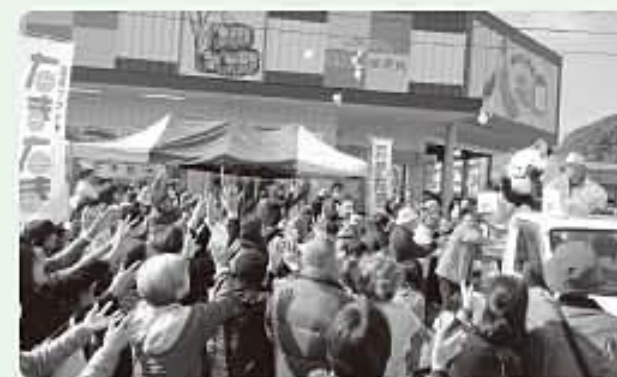
きんかん餅まきの様子