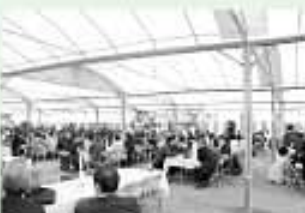
思い出を語る会参加者