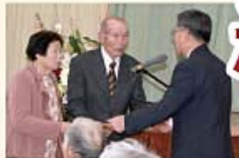
祝い状贈呈の様子