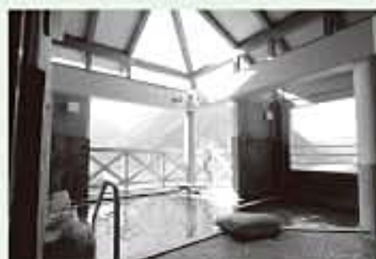
すがすがしい露天風呂