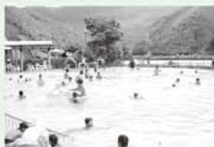
夏のプールも人気あります