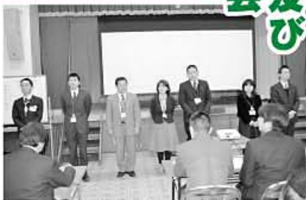
1年間がんばりました! 教育研究所員