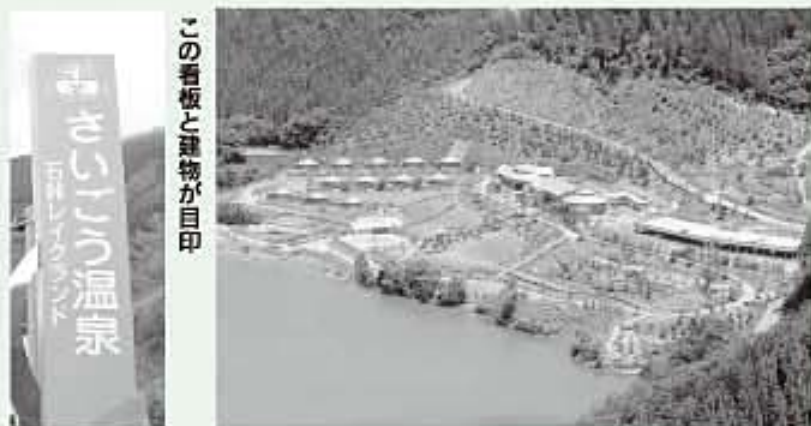
この看板と建物が目印

また、夏にはプールが開放されており、一年を通して家族で楽しめるレジャー施設になっています。ぜひ、ご家族やお友達お誘い合わせの上お越し頂き日頃の疲れを癒やしに来てはいかがでしょうか？