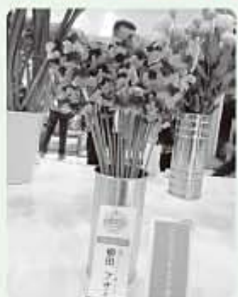
受賞スイートピー