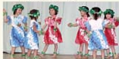
田代幼稚園児によるアトラクション