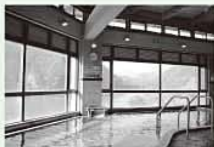
大浴場から耳川を望む

問合せ先 (株)レイクランド西郷 ☎0982-68-2222 定休日:毎週水曜日