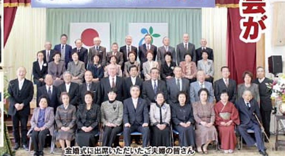
金婚式に出席いただいたご夫婦の皆さん