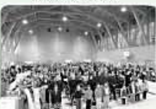
黒木小式典参加者