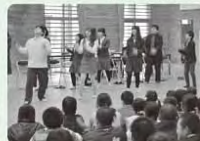
流行のダンスを披露