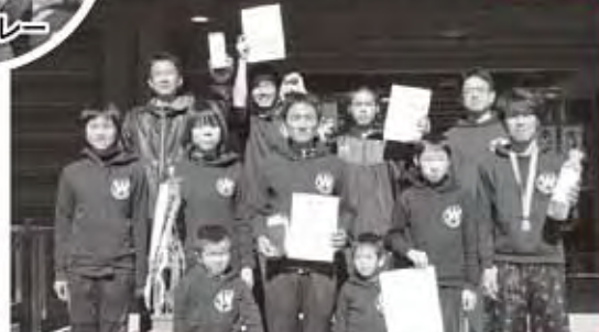
一般の部 優勝「和田ランナーズ」