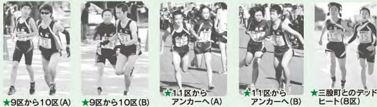
★9区から10区(A) ★9区から10区(B) ★11区からアンカーへ(A) ★11区からアンカーへ(B) ★三股町とのデッドヒート(8区)

本大会参加にあたりましては、町民スポーツ祭の時点から美郷町民の心がひとつになり、多くの皆様のご支援と声援を頂き、今年も立派な成績を残すことが出来ました。監督、コーチをはじめとする関係者の皆様、応援頂いた全ての皆様に紙面をお借りして厚くお礼申し上げます。