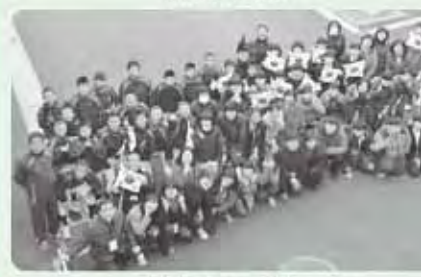
また会いましょう!