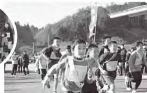
ジュニア・エンジョイの部 スタート!!