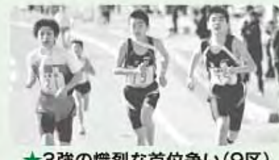
★3強の熾烈な首位争い(9区)