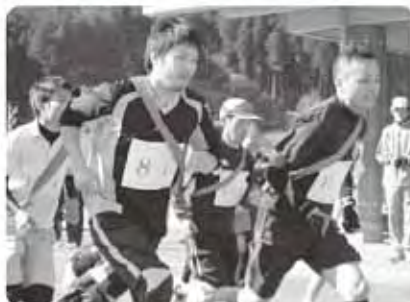
一般の部 スタート!!