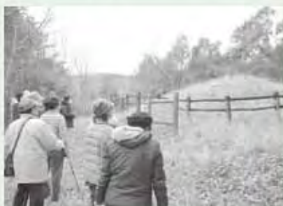
鳥の巣古墳(西郷古墳)

交流と美郷町の魅力を再発見することを目的とした「ふるさと探訪」の第2弾・西郷編が、各地区から18名の参加の下、1月29日(木)に行われました。 午前中は西郷下区にスポーツを当て、東光寺、鳥の巣古墳、鳥の巣愛宕神社と巡りました。東光寺では、お寺の方のご厚意により、貴重な仏具である磬(きんす)や観音堂を見せていただきました。鳥の巣古墳や鳥の巣愛宕神社では、その土地や空気に直に触れながら、地域の歴史を肌で感じる事ができました。 お昼はおせりの滝民話伝承館でおいしい手打ちそばをいただき、おせりの滝に古くから伝わる民話を聞くこともできました。 午後は入郷地区クリーンセンターを訪問。水処理の仕組みを実験形式でご説明いただいた他、施設内の各設備を丁寧な解説とともに見学し、充実の内容となりました。 探訪を通じて、参加者同士の交流を楽しみながら今までの知らなかったふるさとの魅力にふれ、美郷町の知識を深めることができました。