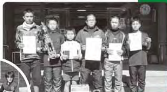
ジュニアの部 優勝「西郷少年野球クラブA」