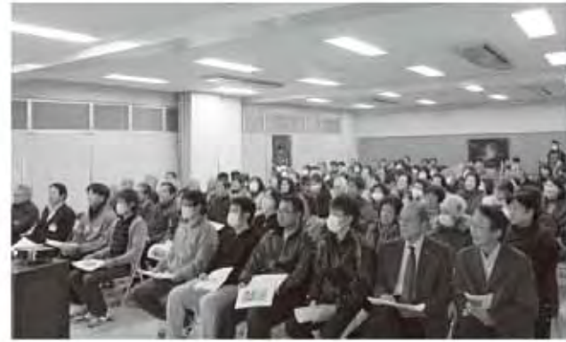
熱心に聴き入っていました