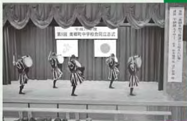
琉星會の力強いエイサー