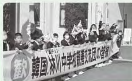
オソオセヨ!(いらっしやい!)

姉妹校交流20周年を記念して両校それぞれに植樹された梅の木が、これから大きく育ち、実が生っていく様に、この交流が日韓友好の架け橋として更に大きく実を結ぶことを願った笑顔の4日間でありました。