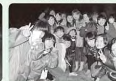
盛り上がった女子