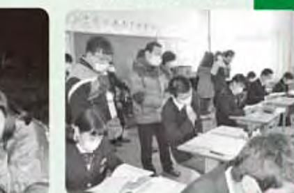
日本の授業を参観