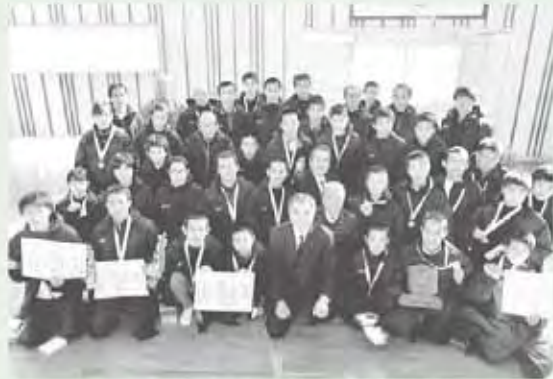
★みんなでつかった銀メダル!