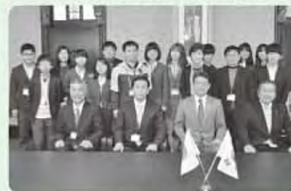
河野知事を表敬訪問