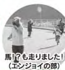
馬!?も走りました! (エンジョイの部)