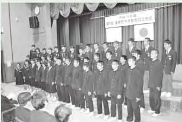
全体合唱「心の中にきらめいて」

この生徒たちが、いずれ美郷を巣立っても、ふるさとを愛し続けながら、たくましく成長していくことを期待するとともに、生徒を支える保護者、先生、地域の先輩達の温かさを実感した一日でした。これからもがんばれ!美郷っ子!