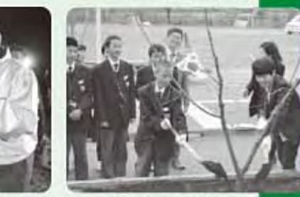
南高梅を記念植樹