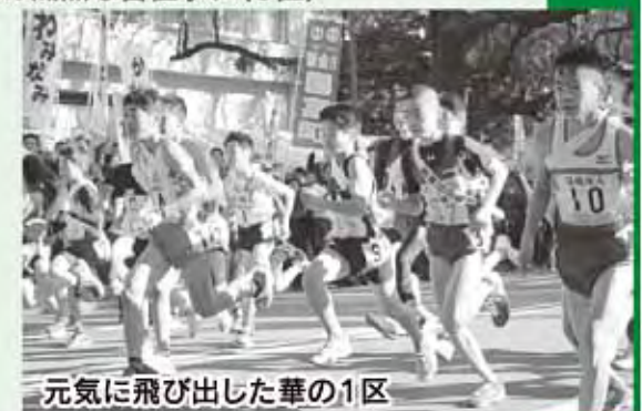
元気に飛び出した華の1区