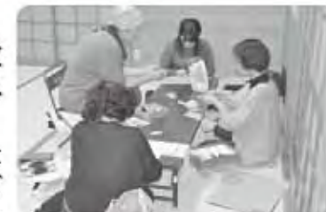
西郷「つるし飾り教室」

平成27年度も「生きがい教室」の開催を計画しています。回覧文書などで受講生募集のご案内をお届けしますので、興味を持たれた方は、ご家族やご友人もお誘い合わせのうえ是非ご応募いただき、生きがいづくりを楽しんでください!