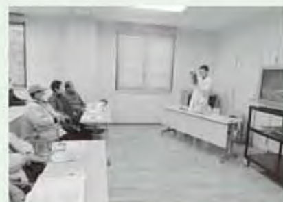
入郷地区クリーンセンターでの実験の様子