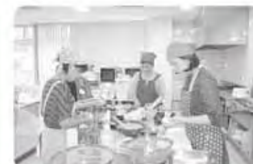
南郷「子育てママのいきいき講座」