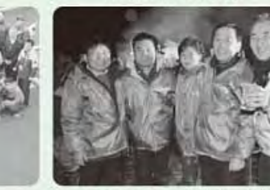
尾畑町長と林川中の先生方