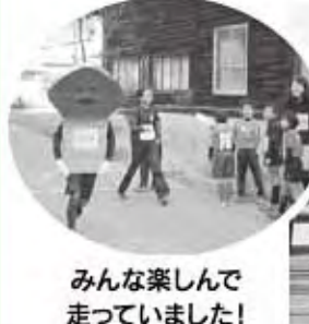
みんな楽しんで走っていました! (エンジョイの部)