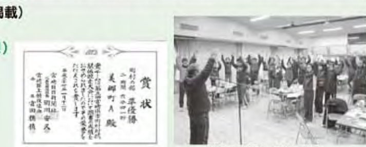
美郷町準優勝万歳!