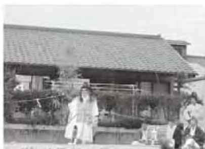
宇納間神社神楽保存会

また、豚汁や焼き肉、かつぼ酒等が振る舞われ、訪れた人たちは冷えた体を温めながら、燃え盛る炎に願いを込めました。