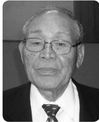
尾上 忠保 議員

①政府は地方創生について、「日本の創生」は「地方創生」なくして出来得ないということ forcefully 言われている。この地方創生について、「人的支援」が大きく報道されており、町長の補佐役についても国が支援をするという考え方である。「人的支援」について、町長の考え方を伺う。