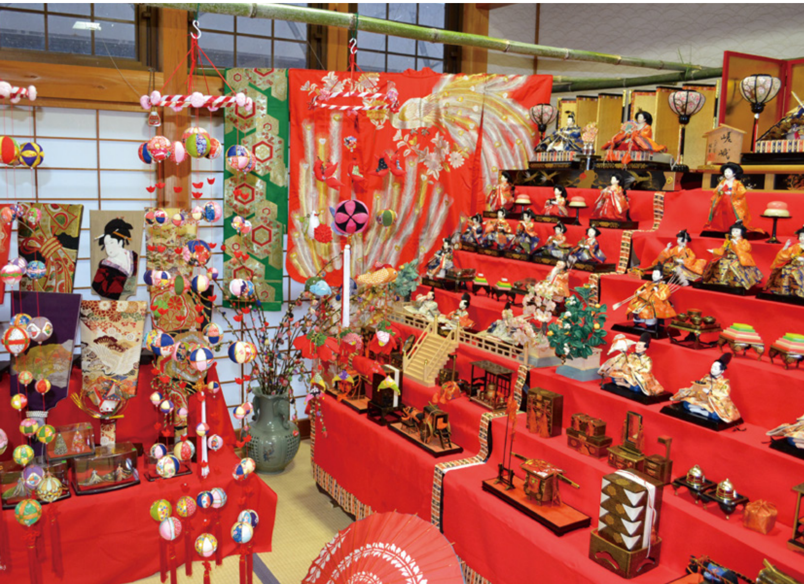
お雛さまとさげ飾り展(年の神/西郷伝統芸能伝習館)

〒883-1101 東臼杵郡美郷町西郷田代1 TEL(0982)66-3607 FAX(0982)66-3137