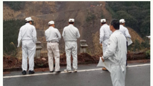
第1回定例会現地調査(町道尾迫・日ヶ隠線)