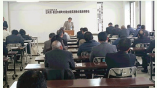
日向市・東白杵郡議員研修会