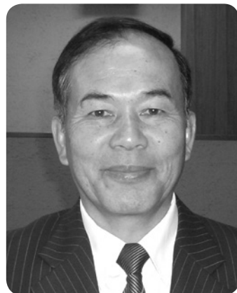
甲斐 秀徳 議員

①林業問題について 木質バイオマス発電、木材の輸出等今後ますます林業が勢いづくのではないか。今後林業作業員、再造林するための杉苗も不足するのではないか。この事をどの様に考えるか。