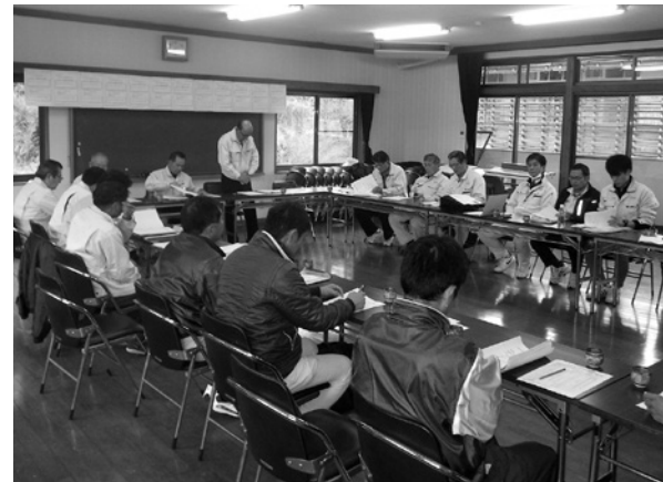
産業建設常任委員会事務調査