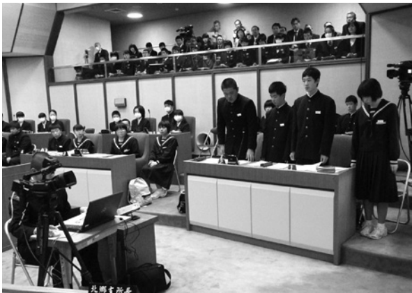
平成26年12月開催子ども議会

【答】(町長) 子どもたちなりによく考えているのだと感じた。 【答】(教育長) 子どもたちの故郷を愛する気持ちにあふれた声を聞き美郷科教育の効果を感じた。