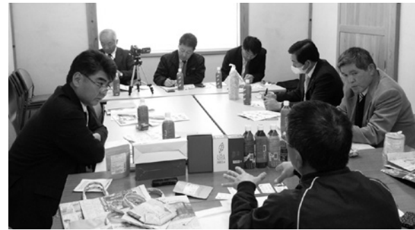
総務常任委員会事務調査