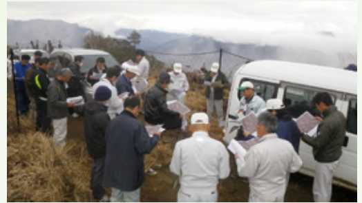
産業建設常任委員会現地調査(西郷宇津神)