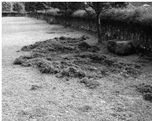
猪による被害(石峠レイクランド)

【答】 幼少の子どもたちの危険や景観上のもあり、電気柵やメッシュネット等の設置ができない状態である。