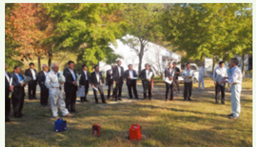
東白杵郡幹部議員研修会