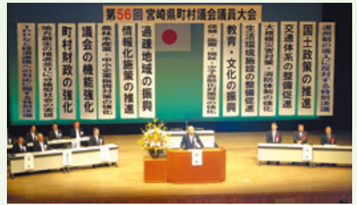
県町村議会議員大会