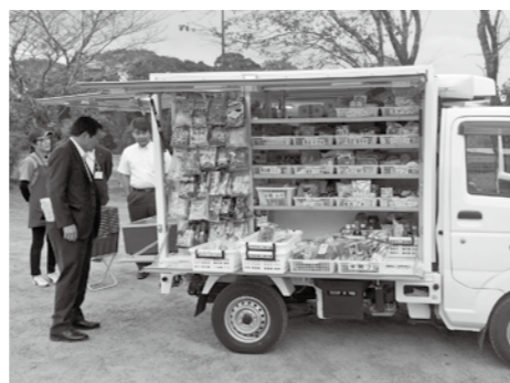
都城市買い物困難者支援事業視察