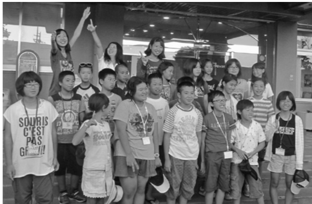
姉妹都市交流事業(沖縄県豊見城市)

【問】合併前から旧村ごとの実施されている交流事業を、町民の一体感の醸成からしても町内の小中学生をまとめて派遣すべきでは。