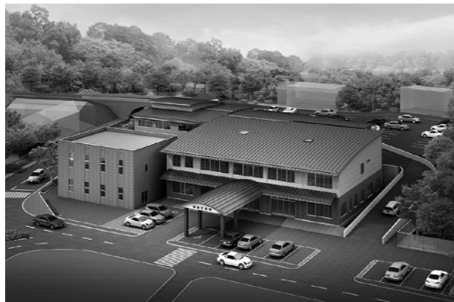
新庁舎イメージ図