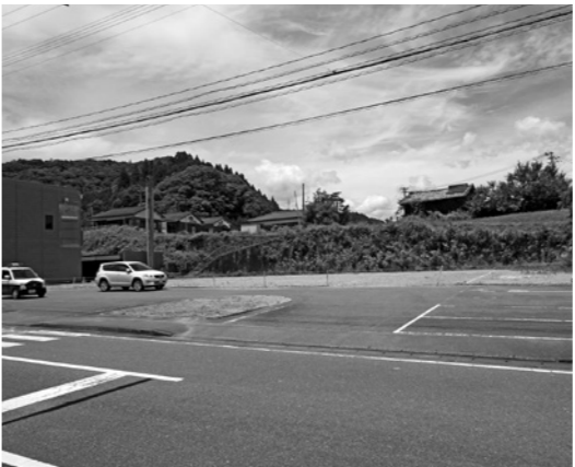
新庁舎建設予定地