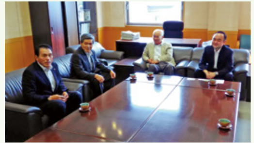
熊本地震災害義援金贈呈