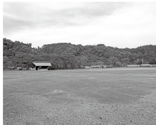
旧北郷小学校跡地

【答】ワンストップ窓口を開設した。各種団体と連携して移住対策をしっかり行っていく。下限面積は農業委員会での検討中である。