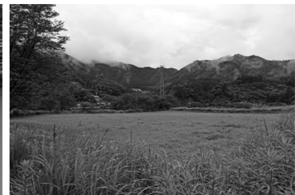
繁殖センター建設予定地(西郷下鶴地区)