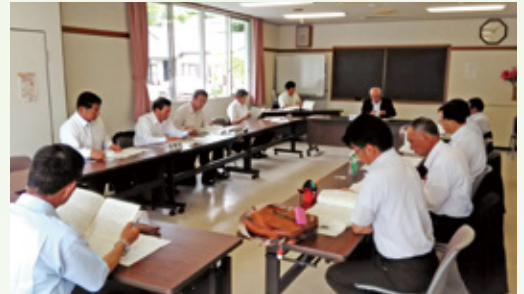
入郷地域開発期成同盟会役員会