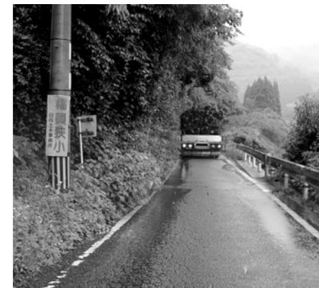
国道388号 美郷町黒木～門川町庭谷間

【問】観光政策の一環として、WiFiフリースポットの設置やホームページのスマホ版の開設等を検討する必要があると考える。 【答】前向きに調査研究しており、実施の方向で検討する。