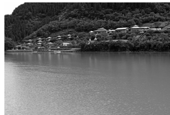
石峠レイクランド(大内原ダム湖)