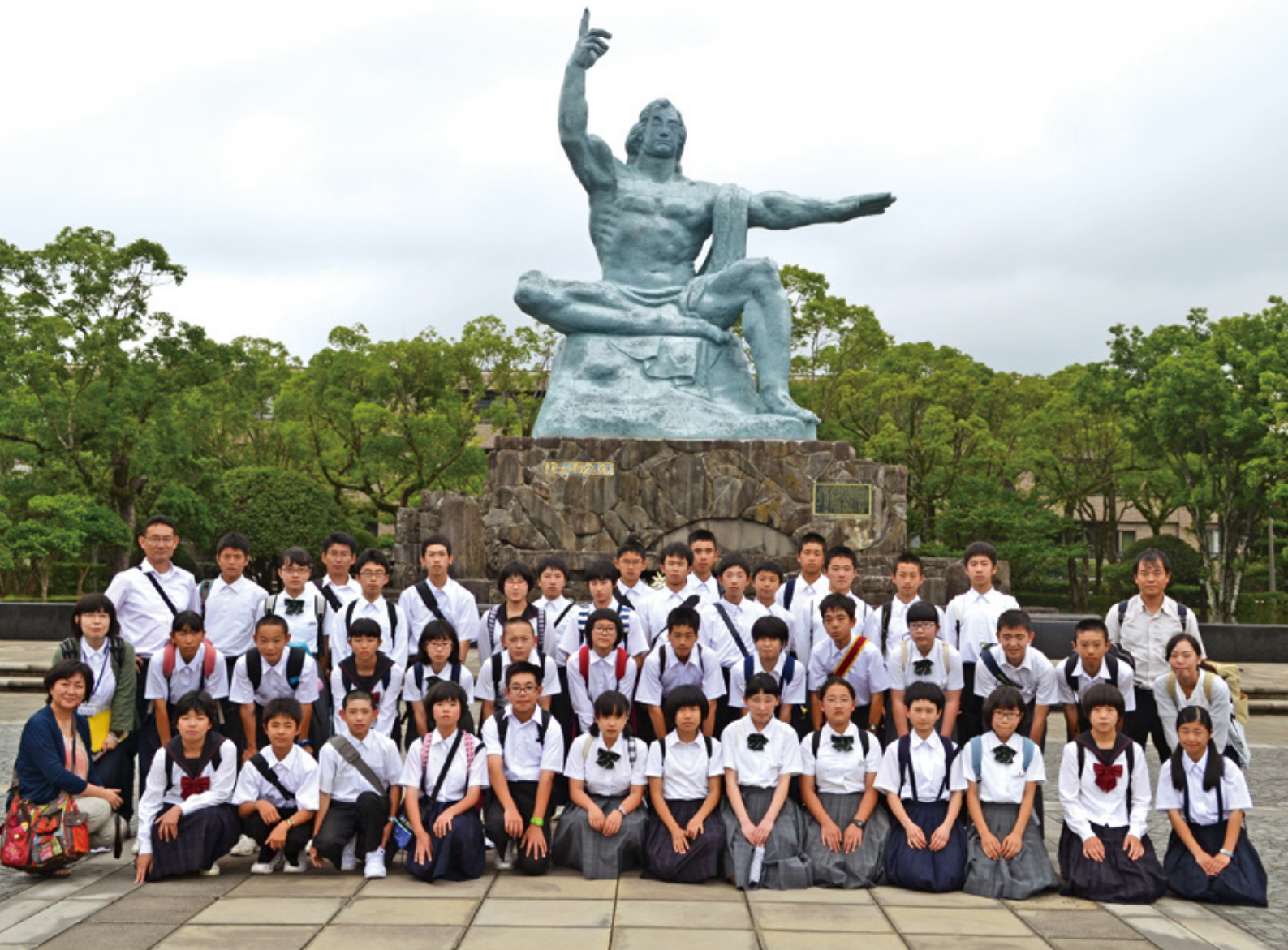
美郷町中学校合同修学旅行

〒883-1101 東臼杵郡美郷町西郷田代1 TEL(0982)66-3607 FAX(0982)66-3137