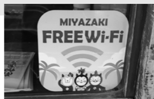
WiFiフリー観光案内所

【問】観光政策の一環として、WiFiフリースポットの設置やホームページのスマホ版の開設等を検討する必要があると考える。 【答】前向きに調査研究しており、実施の方向で検討する。