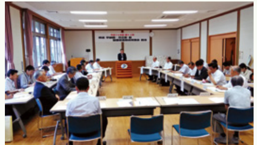
県道宇納間日之影線整備促進期成同盟会総会