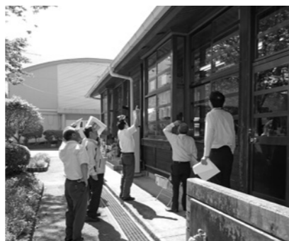
田代小学校校舎屋根被害状況調査

○調査の結果・考察 熊本地震による田代小学校校舎屋根の被害状況を調査後、課題となっている小中一貫校推進の現状と生涯学習の取り組み等について調査を行った。 生涯学習は幅広い事務事業を展開しているが、いずれも地域に定着し成果を上げており、今後も更なる指導力発揮のため、生涯学習分野の職員体制強化を求める。 また、学校教育の充実については、南学園、北学園では、小中一貫教育によるその成果が顕著に表れていることから、学力向上、向学心に欠かせない方策とするならば、積極的姿勢で西郷地区でも小中一貫校の実現に取り組むべきと考察する。