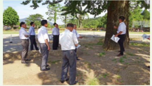
文教厚生常任委員会イチョウの木（町指定文化財） 樹勢回復状況調査