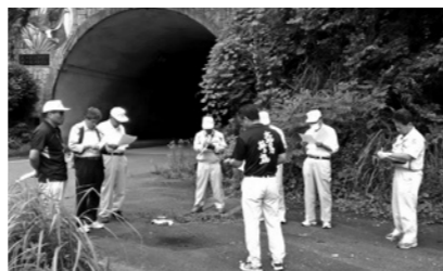
茶屋越トンネル被害状況調査

○調査の結果・考察 地震の被災現場である茶屋越トンネル(南郷鬼神野)、西郷峰区及び西郷下区の家屋周辺の地盤低下現場を視察した。地盤低下は大きいものがあり、水管課による経過観察を続けることで、災害の未然防止を図る必要がある。 また、レイクランド西郷の経営状況、課題について説明を受けた。全体的には単年度黒字であり経営改善が進む一方で、入浴者数の減少、レストラン部門の赤字の問題等、今後その解消に向けた具体策を講じて行く必要がある。