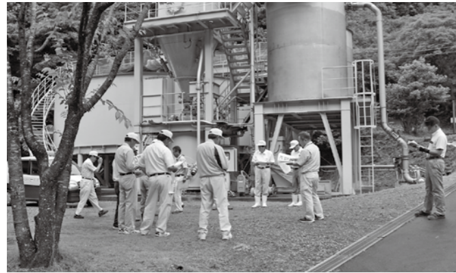
速日鉱山処理施設(北郷 小原)