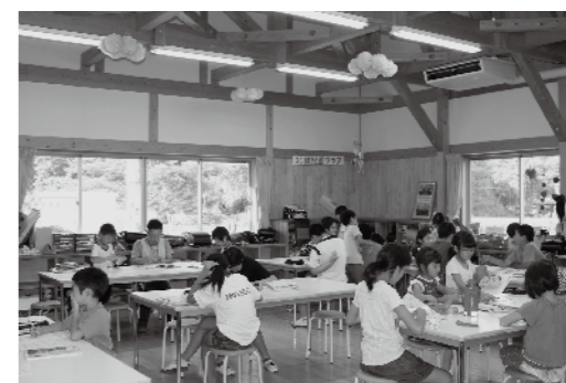
放課後児童クラブの様子