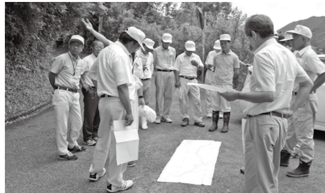
迫内・南風谷線改良予定現場(西郷 田代)