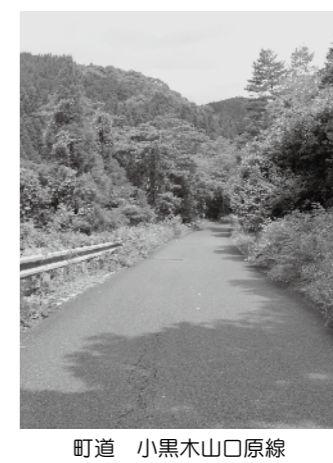
町道 小黒木山口原線

【町長】平成26年度より改良工事が始まっている。思うように進んでいないが、事業費が付けば早くできる。予算が付き次第である。