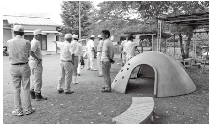
神門保育所(南郷 神門)