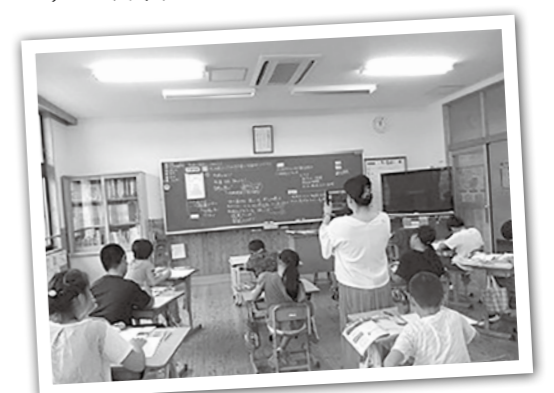
タブレットを使用している授業風景