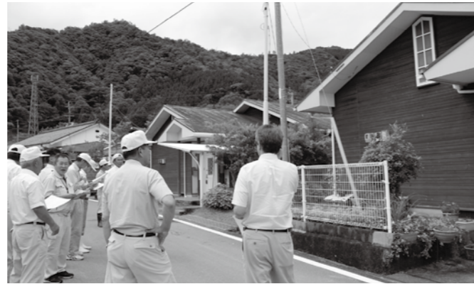
公営住宅改修予定家屋(北郷 入下)