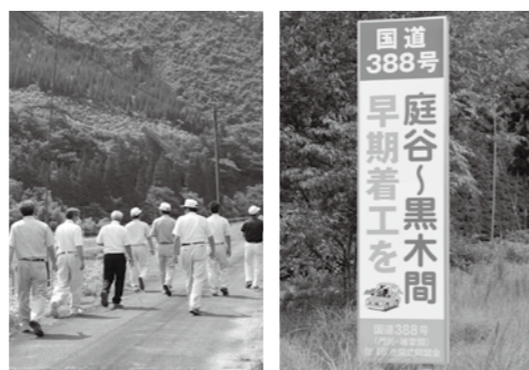
現地での実際の踏査