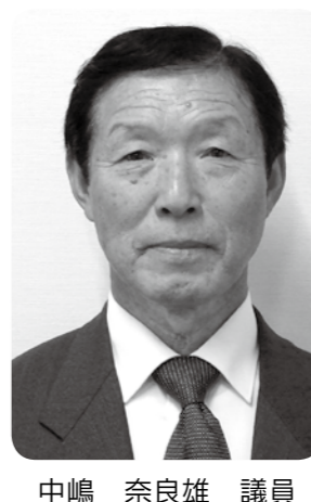
中嶋 奈良雄 議員