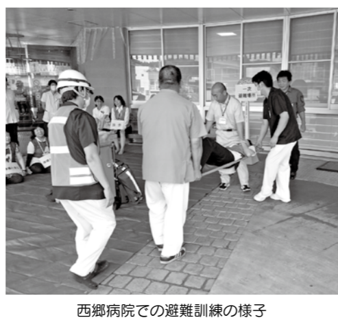
西郷病院での避難訓練の様子

【西郷病院】年に一回、夜間を想定した訓練を行っている。基本的には、看護師2名、医師1名、警備員1名で対応するが、火災報知器が作動すれば、自動的に職員・消防担当に一斉メールがいくことになっている。かけた職員、消防団、近隣の住民の力も借りて避難誘導する。