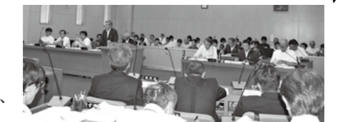
第2回定例会のようす