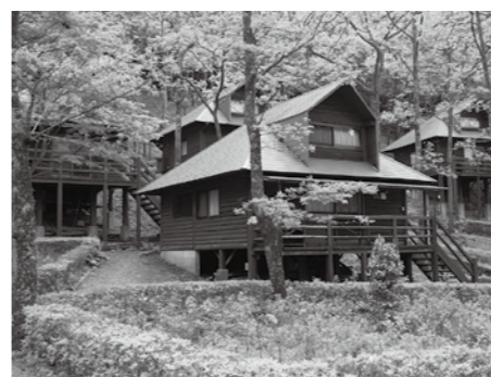
指定管理者の運営となる中小屋キャンプ場

放射線取扱手当：給料月額8%⇒段階的に引き下げを行い、平成33年度に12,000円とする。