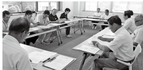
町民生活課への調査