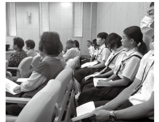
第2回定例会の傍聴席