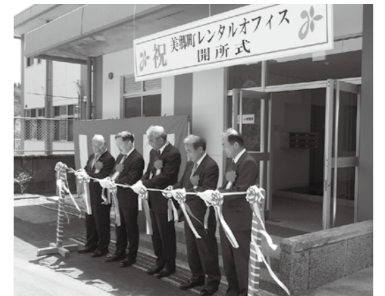
レンタルオフィス開所式