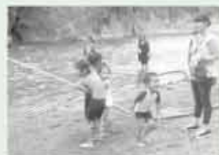
小型ポンプ放水体験