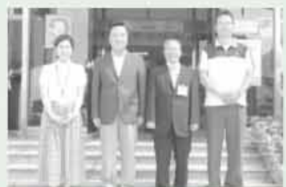
扶餘邑庁を表敬訪問