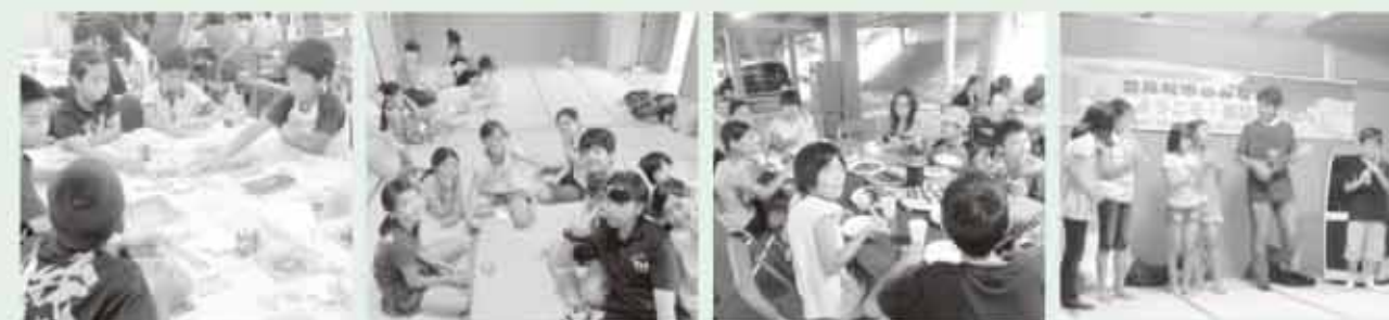
ウーシ染め絵付け体験 2日目朝のひととき 石峙レイクランドで夕食交流 交流会での様子

パランクーや大太鼓を打ち鳴らす中、激しく降り続けていた雨も止み、子どもから青年までの勇壮な「舞」に会場が沸きました。夏祭りを楽しんだ後は北郷総合保健センターに宿泊し、3日目の朝にお別れをしました。訪問と受入での交流で仲良くなった子どもたちは、恥ずかしながらも別れを惜しんでいます。 今回の交流事業でさらにお互いの歴史・文化・くらしを学び合い、活動における規律や団体行動、平和についての学習や体験をしたことにより、姉妹都市の絆を一層深めることができましたのではないのでしょうか。