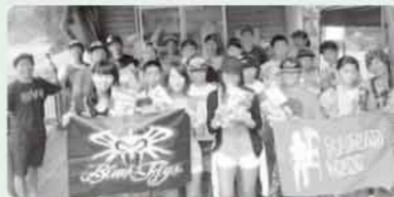
今回参加した中高生の方々