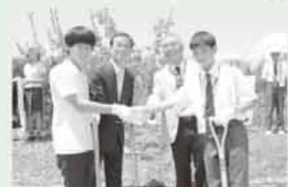
心を込めて梅を植樹