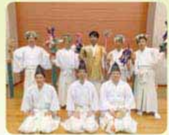
第63回 宮崎県青年大会

近年県内の青年団会員数は年々減ってきており、競技種目や参加チームも減少する中、美郷町青年団は毎年出場を続けています。今後もこの大会を通して青年団が一致団結して地域を盛り上げてくれることを期待しています。そしてその姿を見た子どもたちの中から、将来青年団で活躍したいと思う人材が育ってほしいと願っています。結果につきましては、次のとおりです。