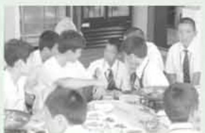
気持ちは通じたよ!