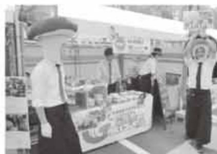
売り込みにも熱が入ってます!