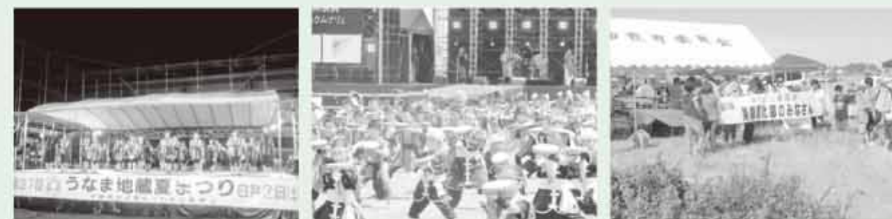
うなま地蔵まつりエイサー交流祭 全沖縄エイサーまつりでエイサーを披露する北郷・豊見城市子ども会 歓迎式会場での顔合わせ