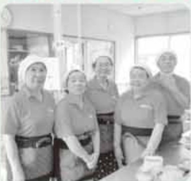
おいしい配食作ってます!