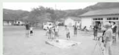
スイカ割りの様子