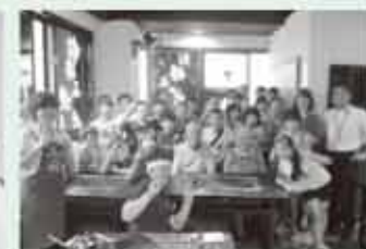
職業講話「もんじゃ焼き こた」