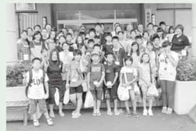
お別れ式で記念撮影(北郷、豊見城市の子ども会と引率者)

太平洋戦争中の昭和19年8月から同21年11月までに、豊見城市2国民学校の児童53人が北郷村に疎開したのが縁で、北郷の子ども会は、本町と姉妹都市盟約を締結している沖縄県豊見城市と青少年派遣交流事業を行っています。26回目となる今回の交流は、北郷の小学5年生7名と中学生・高校生のジュニアリーダー2名が参加しました。 7月26日から28日にかけては豊見城市へ訪問し、国際通り・公設市場の散策や、旧海軍司令壕での平和学習、全沖縄エイサーまつりへの出演、ウーシ染め絵付け体験など、普段ではあまりできない体験ができました。また澄みきった海を見わたせる瀬長島での歓迎式では、地元子ども会や関係者の皆さんから手厚い歓迎とおもてなしを受けました。 8月1日から3日にかけては豊見城市の子どもたち（小学5年生18名・ジュニアリーダー4名）が本町を訪れ、初日は石峙レイクランドに宿泊しました。台風の影響で天気が心配される中、バーベキューで親睦を深め、交流会では楽器演奏・歌の披露、ゲームなどを楽しんでいました。2日目は、天気の影響で急遽予定を変更し、陶芸体験や諸塚村の屋内プールでの水遊びを楽しんだ後、うなま地蔵まつりエイサー交流祭で、北郷と豊見城市の子どもが合同でエイサーを披露しました。懸命に