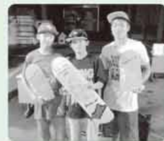
受賞おめでとうございます!!