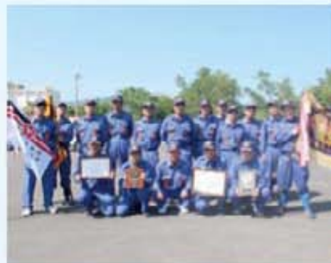
積載車の部優勝 南郷分団 第6部