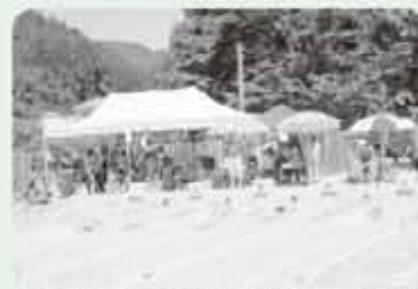
自己記録更新を目指してがんばりました。

炎天下で行われたにもかかわらず、たくさんの保護者や地域の方々からの力強い声援があり、児童たちも後押しされるように暑さに負けない元気な泳ぎを見せてくれました。