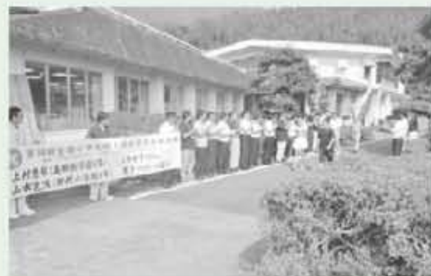
照れながらもうれしそうに来庁されました。

選手はもちろん、選手を指導される関係者の皆様に敬意を表し、全国大会での健闘を期待しています。頑張れ!美郷っ子!!