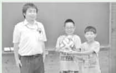
ブラズーカを受け取り大喜びの子どもたち

なお、北郷小学校、黒木小学校、美郷南学園においても、それぞれ宇納間郵便局、入下郵便局、神門郵便局より寄贈していただいております。