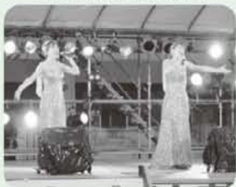
「黒木姉妹」のライブ