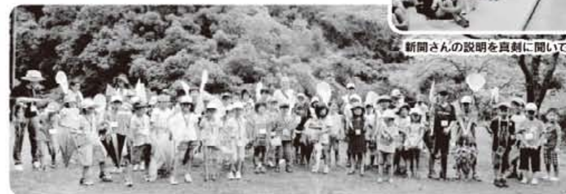
いろいろな虫をみつけて最後に記念写真!