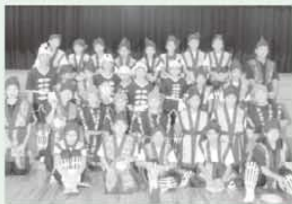
沖繩・北郷子供会エイサー