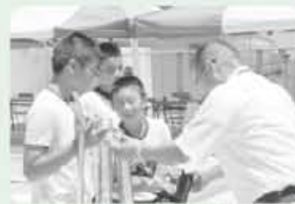
田代小優勝おめでとう!