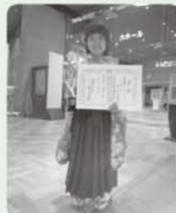
緊張したけど頑張りました