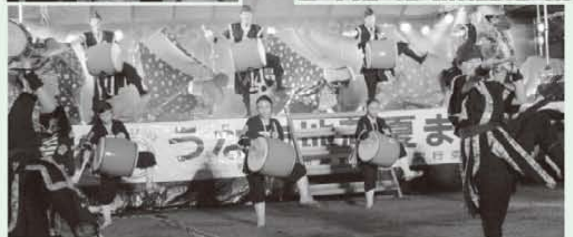
エイサーと獅子舞のコラボレーション