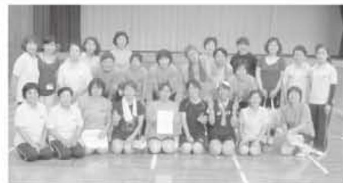
優勝した「南郷パワフルズ」と南郷選手団