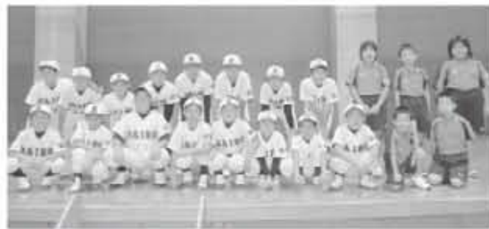
西郷少年野球クラブ・美郷ジュニアソフトテニスクラブ

結果は、予選敗退という残念なものでしたが、県大会という大きな舞台で堂々とプレーができ子ども達の自信に繋がったことと思います。これからの田代少女バレーボールクラブの活躍に期待します。