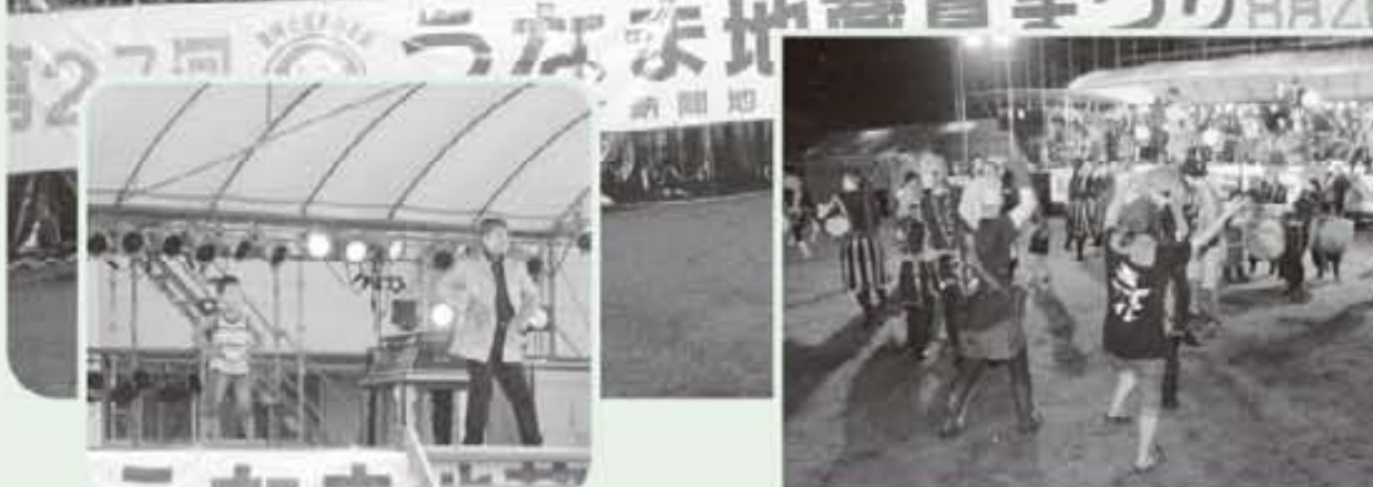
「CHUTA」の変面マジックショー