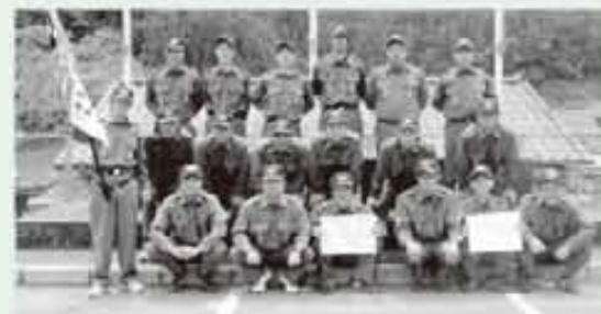
積載車操法の部 優勝 南郷分団 第6部