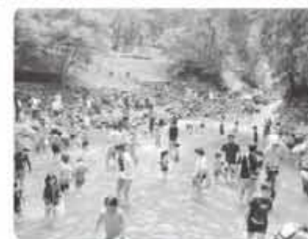
おせりの滝河川プール

衝撃!驚き!大発見!世界 ミステリーFILE 入門百科+14 (児童書) 山口直樹 著