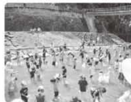
小川川セーフティランド

おせりの滝河川プール及び小川川セーフティランドは、8月31日(日)まで開設しています。