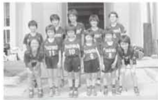
田代少女バレーボールクラブ