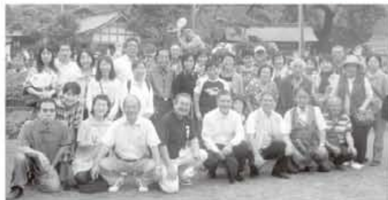
出迎いの町長、副町長と共に帰郷記念写真

今回、このような企画をしていただきました宮崎西郷会及び宮崎五十鈴会をはじめ関係者の皆様から心から御礼申し上げます。今後も出身者の方々との絆を大切にしていきたいと思っております。