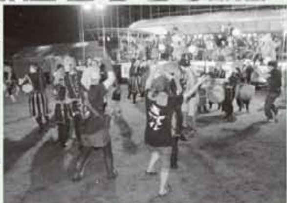
カチャーシーで会場大盛り上がり!!