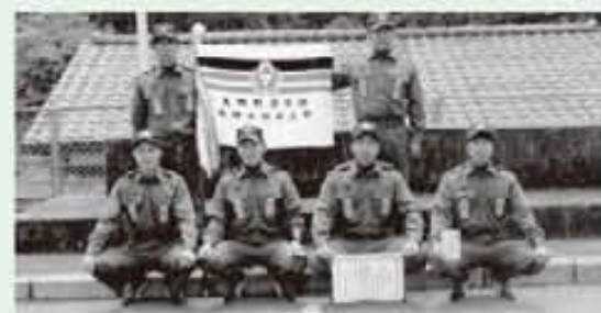
小型ポンプ操法の部 優勝 南郷分団 第3部