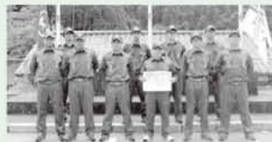
ポンプ車操法の部 優勝 北郷分団 本部