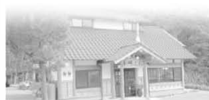
窓から四季折々の風景が楽しめる

当店のPRにも活用できるフェイスブック等を使って、今後たくさんの情報をスムーズに発信していけるよう、日々悪戦苦闘しています。