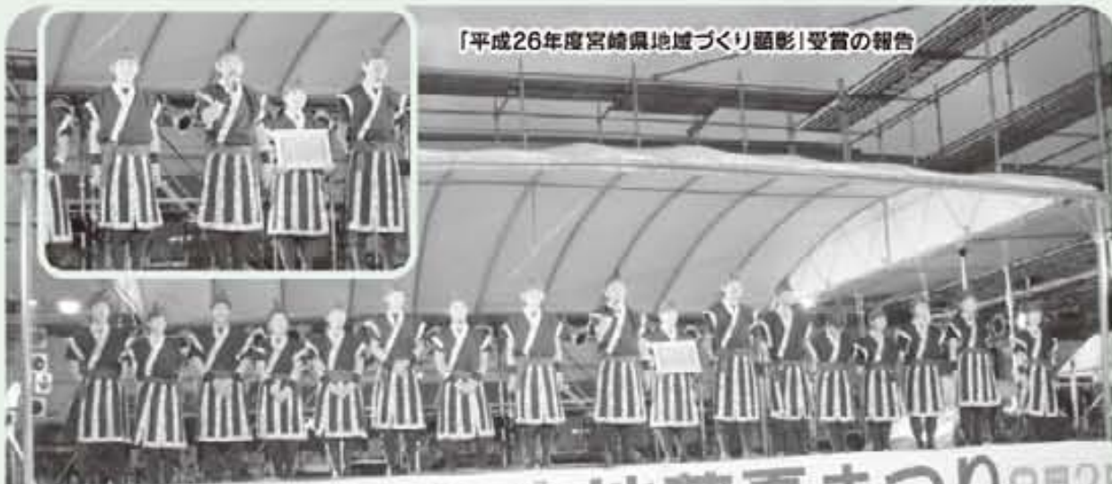
「平成26年度宮崎県地域づくり顕彰」受賞の報告