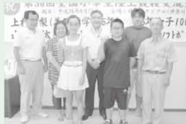
自己ベスト更新を目指して頑張ってください。