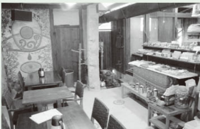
落ち着いた店内の雰囲気