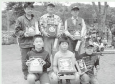
ヤマメ釣り入賞者