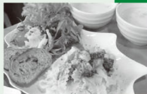
エビとブロッコリーのパスタ