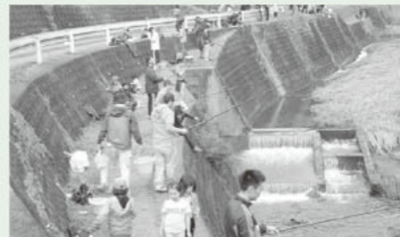
ヤマメ釣りにぎわい