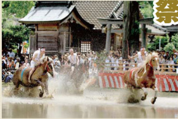
2013年フォトコンテスト特選「激走」