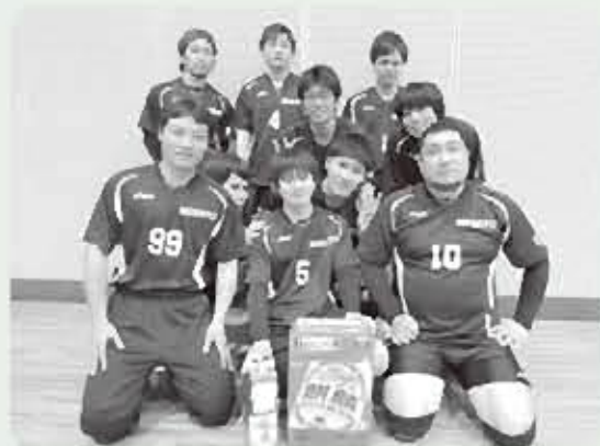
男子の部 優勝 アカツキ