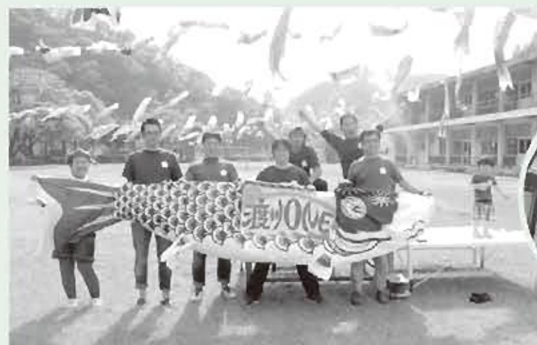
地域活性化グループ「渡川ONE」

また、渡川地区地域活性化グループ「渡川ONE」の代表を務めており、季節ごとのイベントや地元の情報発信に力をいれ活動しています。渡川地区はもちろん美郷町がもっともっと元気な町になるよう、盛り上げていきます。