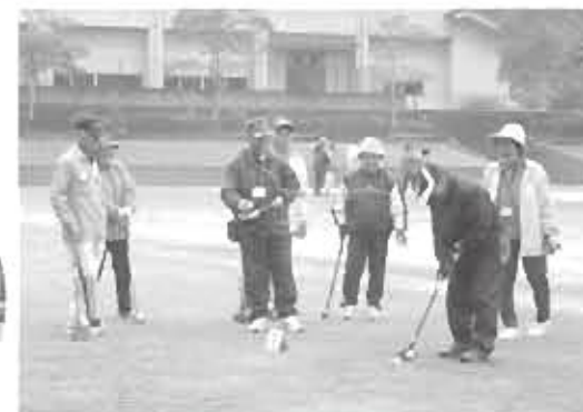
みなさんお元気です