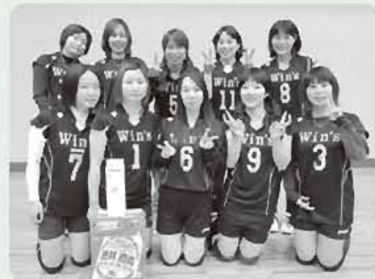
女子の部 優勝 Win's

本年度もバレー技術の向上と愛好者の親睦を深めることを目的に大会を開催していきますので、多数の参加をよろしくお祈りします。