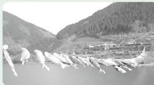
湖をはねる鯉の群れ!