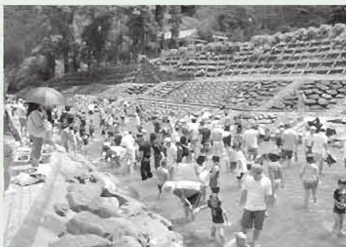
小川川河川プール開き