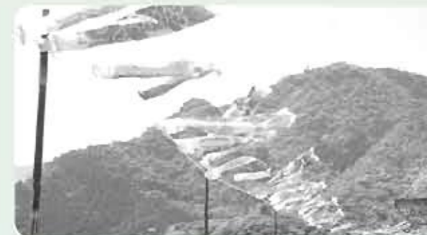
風にたなびく鯉のぼり