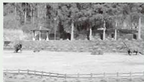
広場にたたずむ恐竜のオブジェ