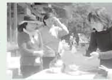
ごはんの量を計測しました。