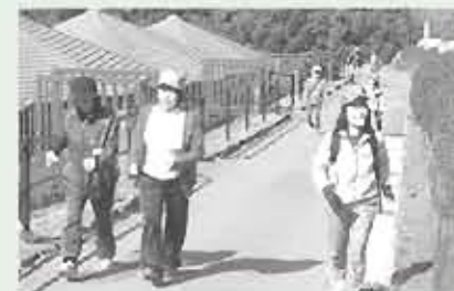
レイクランド園内をウォーキング

健康福祉課では、これからも楽しく健康づくりができるよう様々なイベントを計画していく予定ですので、ぜひ参加してください。