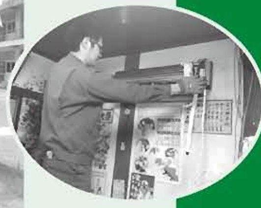
工事中のまなざし