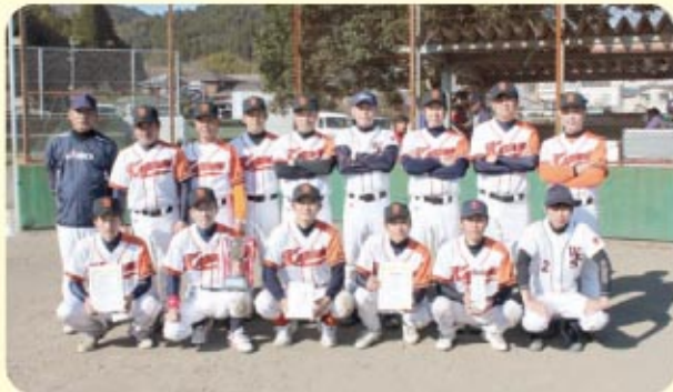
準優勝 若宮カグラーズ