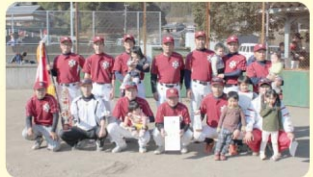
優勝 神門下イーグルス