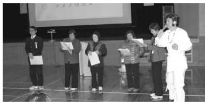
神話・伝承講座「みやざきの言の葉」

午後からの「ふれあいのひと時(芸能発表)」では、各区から12団体の出演がありユニークな踊りやバンド演奏、和太鼓などが披露され、とても楽しいひと時をすごしました。