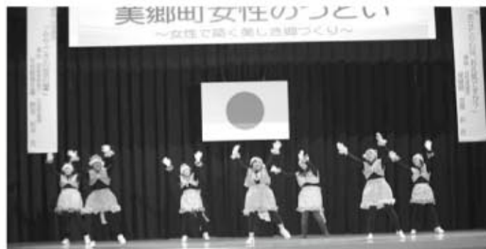
「ふれあいのひと時」