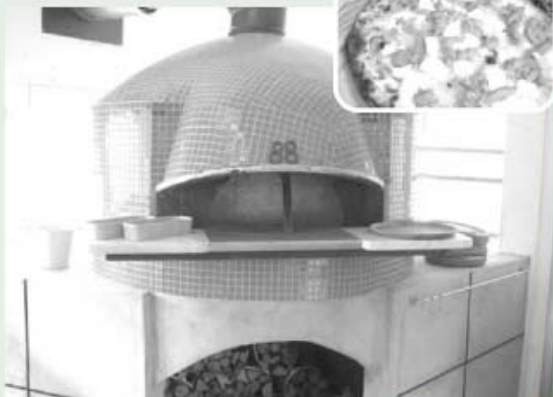
ナポリ直輸入薪窯