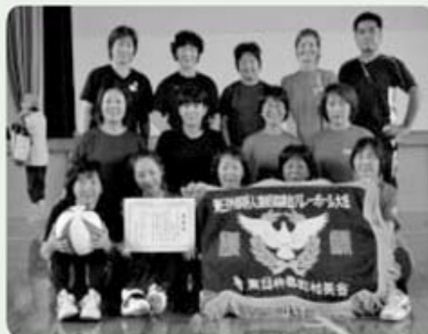
優勝した西郷Aチーム