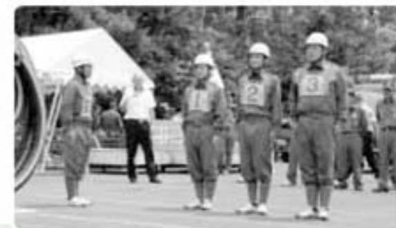
第9位 西郷分団第5部