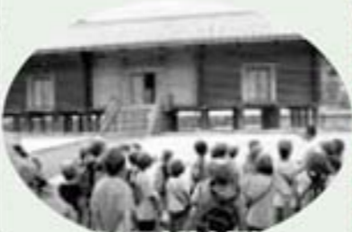
西の正倉院を探検