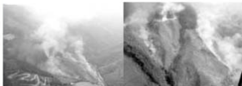
上空からの火災の様子