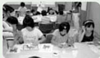
旭化成による発電実験(北郷図書館)

ご協力いただいた皆様方にこの場をお借りして深く感謝申し上げます。 このミステリーツアーを写真で振り返ります。