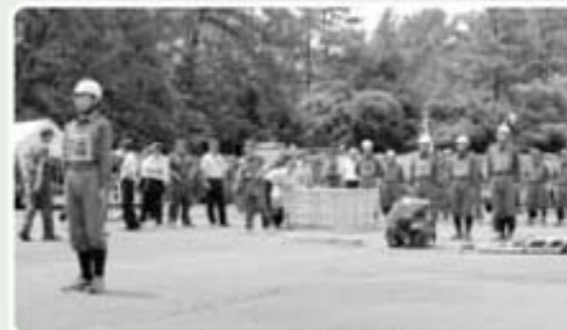
第3位 南郷分団本部