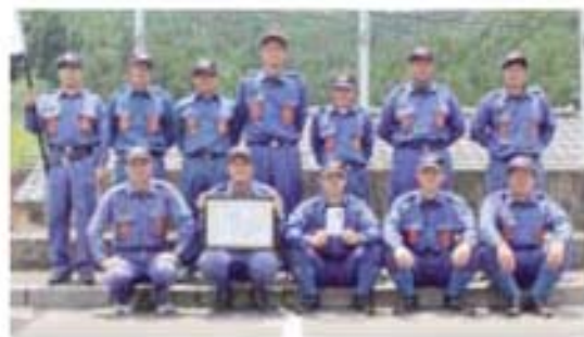
小型ポンプ操法の部 優勝 南郷分団 第5部