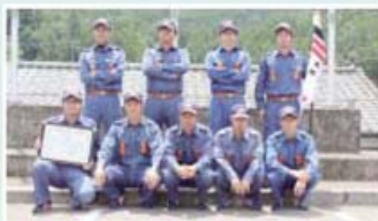
ポンプ車操法の部 優勝 北郷分団 本部