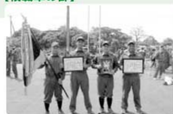
優勝 南郷分団本部