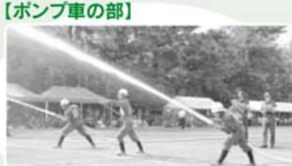
準優勝 北郷分団本部