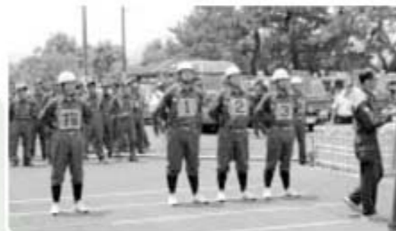
第6位 北郷分団第3部