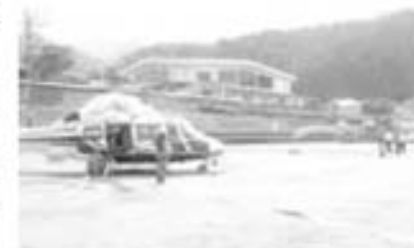
熊本県防災ヘリ「ひばり」

林野火災の多くは人災です。私たち一人ひとりが気をつければ防ぐことができる災害なのです。山火事防止のために、皆様のご協力をお願いします。