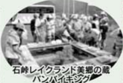
石峠レイクランド美郷の蔵 バンバイキング