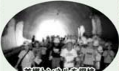
美郷トンネルを探検 (西郷から南郷へ)