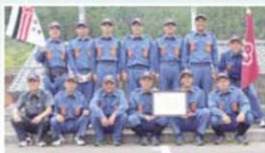
積載車操法の部 優勝 南郷分団 本部