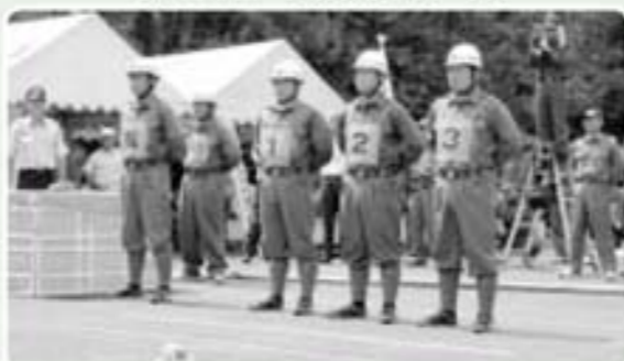
第8位 南郷分団第5部