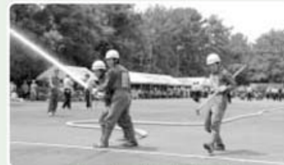
第5位 南郷分団第3部