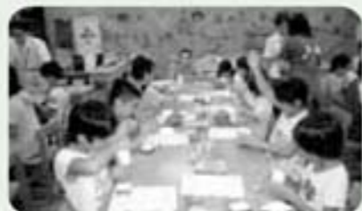
日向日サイクルセンターによるエコ工作 (林業技術センター森の科学館)