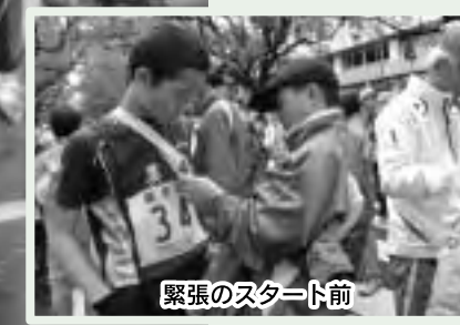
緊張のスタート前