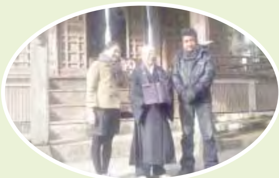
宇納間地蔵尊でスピリチュアルに触れました