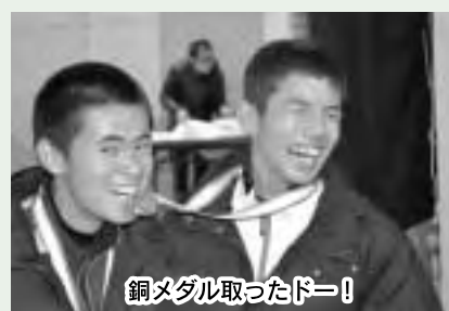
銅メダル取ったドー！