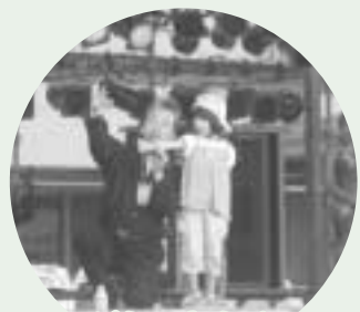
ジミーキクチ マジックショーに会場騒然！