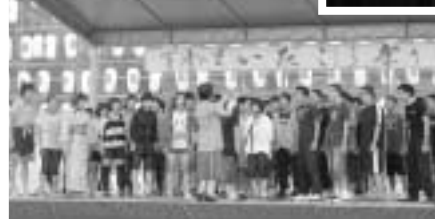
美郷南学園による合唱