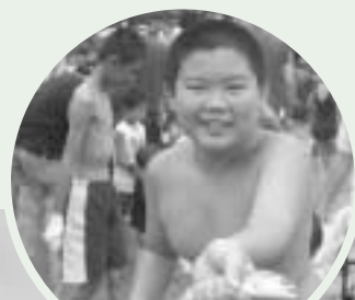
つかみ取り ほら見て、やったよ！