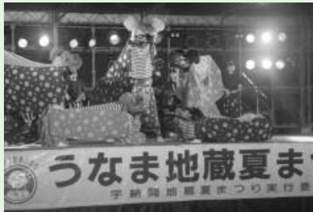
天翔獅子 ストーリー性に溢れた獅子舞「天翔獅子」