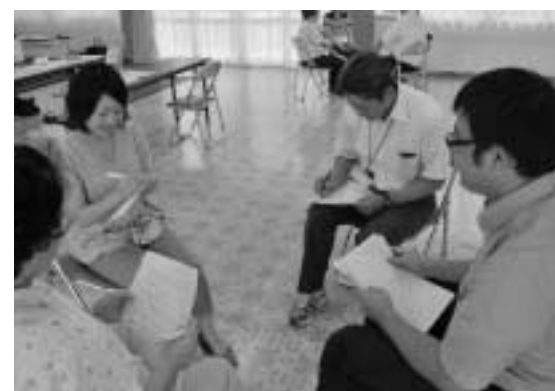
学力向上研修会の様子