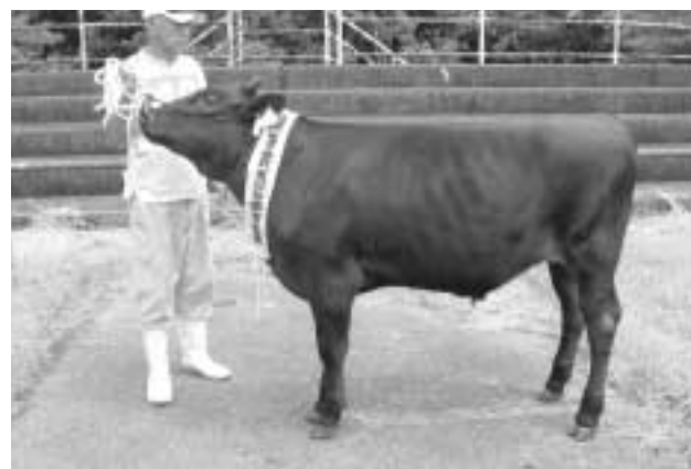
「猿回転89」号 優等賞三席

れています。郡共進会での優等賞受賞は、3年ぶりといふことで久々の受賞に大変、うれしそうな表情を見せていました。日頃の飼育管理に敬意を表するとともに、今後益々の活躍を期待します。