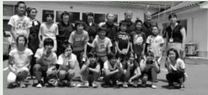
そば打ち指導をして頂いた島根県美郷町の皆さんと

島根県には、世界遺産に登録されている石見銀山があり、遺跡や歴史について学んだほか、銀を使ったストラップ作りに挑戦しました。また、本町と同名の美郷町では、ボランティアの方達にそば打ちの指導を受け、自分で打ったそばを昼食としていただきました。そのほか、ガラス工芸やカヌーの体験学習も行いました。