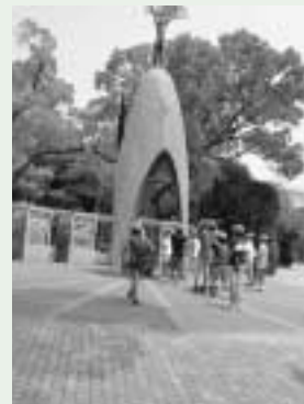
広島県平和記念公園で平和学習

ほとんどの行程で電車・新幹線・船等を利用し、公共交通機関の利用の仕方についても学習しました。研修生は、3つの世界遺産や教育文化施設の見学、派遣先での様々な交流体験を通して、大変有意義な3日間を過ごしました。