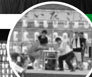
南郷青年団によるアームレスリング