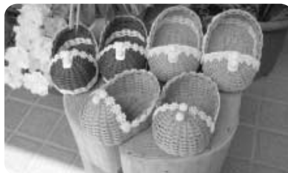
エコベビーシューズ

各講座4回程度にしており、今年度は「エコベビーシューズ作り」「英会話教室」を開講し、毎回多くの方に参加していただいております。今後は「習字教室」や「編みかご教室」など魅力ある講座を計画していきます。組合回覧などで参加募集をしますので、ご家族ご友人にお声を掛けてご応募下さい。