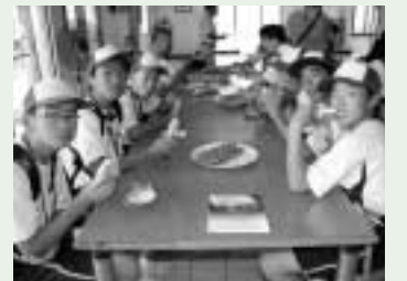
林院長先生「マシッソヨ!」 美味しいです!

また、ソウル市内の仁寺洞(インサドン)での2時間に及ぶ班別自由行動や、歴代国際交流員のうち5名の方々に再会出来たことなど、生徒にとっては忘れることの出来ない素晴らしい体験となりました。