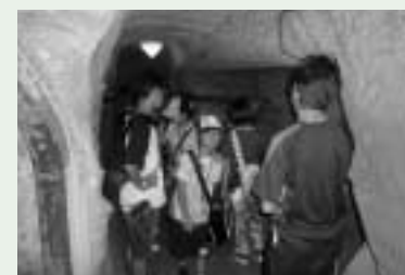
旧海軍司令部壕見学

8月3日から5日にかけては豊見城市子ども会(小学5年生5名・ジュニアリーダー3名)が本町を訪れ、北郷区子ども会の各家庭が民泊で受け入れを行いました。3日間はあいにくの雨でしたが、各家庭で川遊びや町内案内などを企画し、うなま地蔵夏祭りを一緒に楽しみました。帰る頃にはすっかり仲良くなってみんなで別れを惜しんでいます。