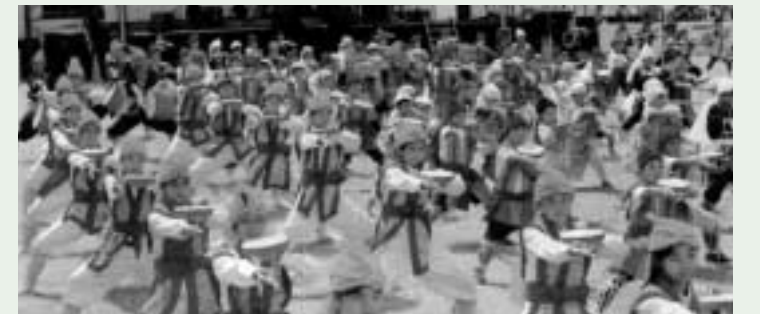
沖縄エイサー祭りに出演

7月28日から30日にかけては豊見城市へ訪問し、平和学習、エイサー祭りの出演、ハーリー(手漕ぎ舟)体験など、普段はあまりない体験ができました。また、地元子ども会との民泊交流では、それぞれ非常に手厚いもてなしを受けました。