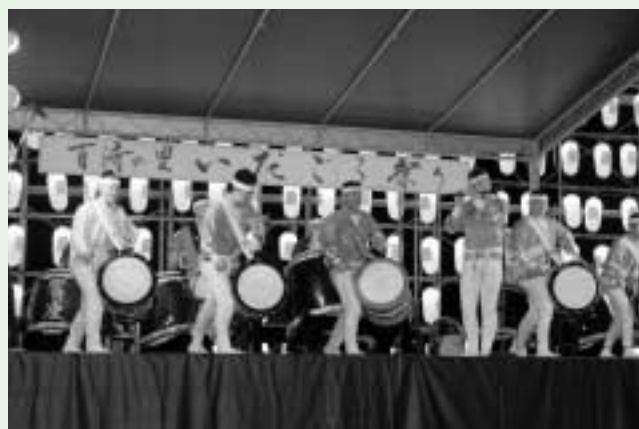
響座 魅せます 橋太鼓「響座」