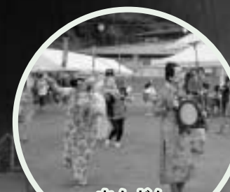
ちんどん 笑いの渦が巻き起こる！