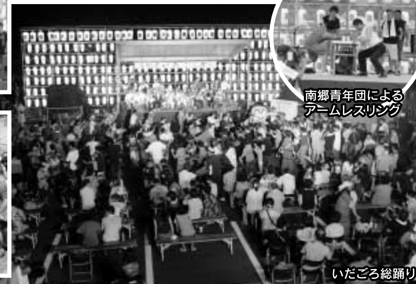
いだごころ総踊り