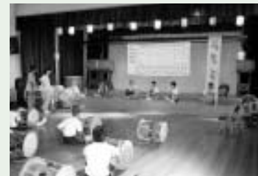
サムルノリ教育院で基礎を特訓

姉妹校である林川(イムチョン)中学校での交流活動では、林川中学校の生徒と美郷南学園の生徒とが韓日混成でチームを編成し、体を使った様々なゲームと一緒に楽しみました。言葉は英語・韓国語・日本語を織り交ぜながら片言でしか通じなくても、表情やボディランゲージで相手と心や気持ちを通い合わせる事が出来るという、社会に必要な大事なことを肌で学ぶ貴重な国際理解教育の場となりました。