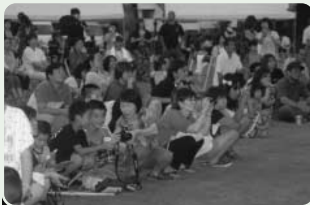
観客 大勢の観客がシャッターチャンス待ちます

祭りの運営にご協力いただきました方々におかれましては、心から感謝しますと共に各方面から祭りを盛り上げていただいた皆様に厚くお礼申し上げます。