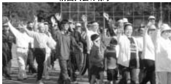
天候に恵まれますように