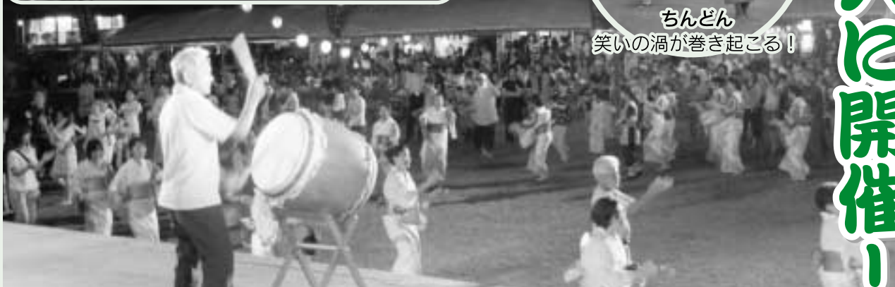
盆踊り 会場に踊りの大きな輪ができた「町民総踊り」