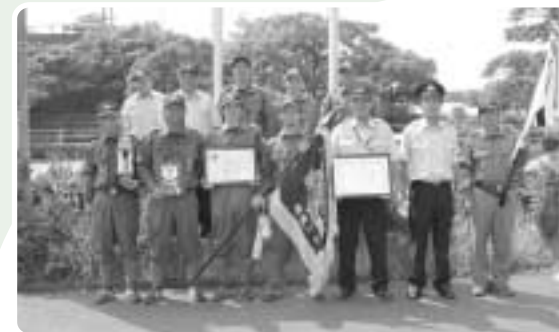
優勝 南郷分団第2部