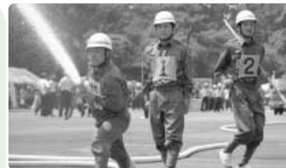
第9位 西郷分団第5部