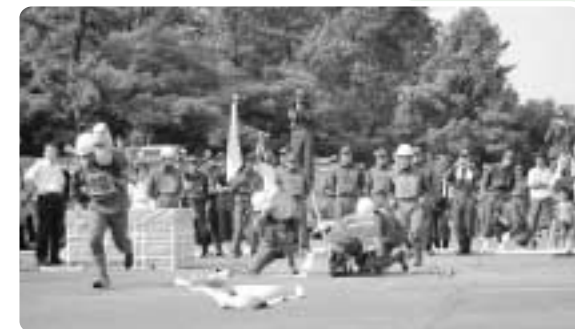
第7位 南郷分団第3部