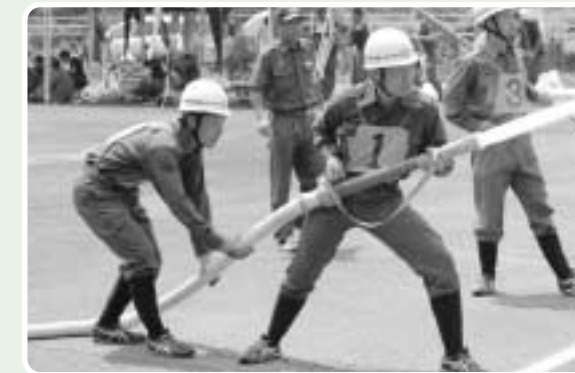
準優勝 北郷分団本部