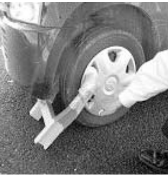
併任人事交流では、悪質な滞納者に対して地方税法第48条に基づき県へ徴収引継を行う他、給与、預金などの差押え、自動車のタイヤロックの実施を行います。