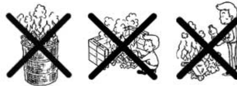
ドラム缶 ブロック積み プラスチック類の焼却

ドラム缶焼却、ブロック積み焼却、穴を掘ってのごみ焼却は、野外焼却(野焼き)と同じですので行わないでください。