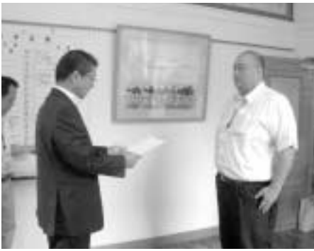
町と県は協力して滞納町税の解消と滞納整理、差押等の強制処分を進めていきます。 本年度は6名の県職員に対して、7月11日に税務職員併任辞令交付が行われました。