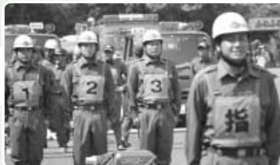
第3位 南郷分団第5部