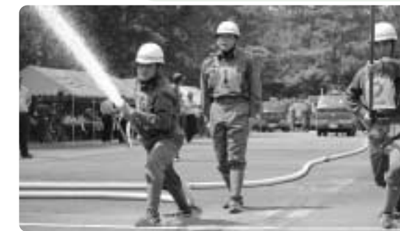
第6位 南郷分団第3部