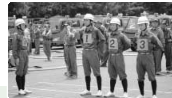
第10位 北郷分団第1部