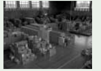
体育館内の支援物資(日用品・食料品)