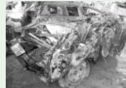
津波に飲み込まれた車