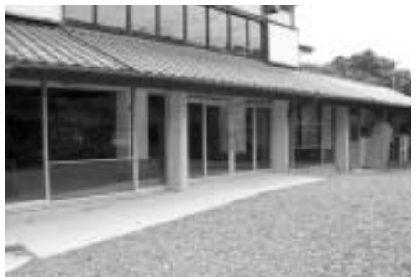
【出入口はバリアフリーに改装】

南郷茶屋をご利用ください 稼働を休止しておりました南郷茶屋が新しく多目的集会施設として生まれ変わりました。これにより会議や研修会などの各種集会の開催が可能となったほか施設の一部改修を行い葬祭場としての利用も出来る様になりました。 6月1日より運用を開始しております。利用方法など詳細については次表のとおりです。ご利用を希望する場合は南郷支所総務課 ☎59-1601(までお問い合わせください)。