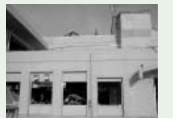
校舎側面(人が写っている付近まで浸水)