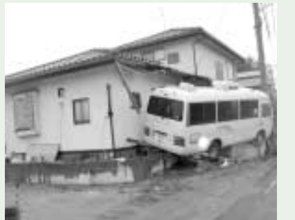
頑丈な家屋は壊れないものの浸水被害あり