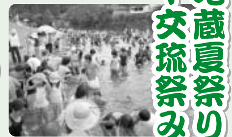
魚のつかみ取り大会