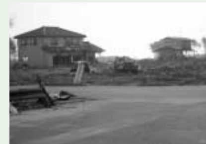
家屋被害(基礎のみが残る)