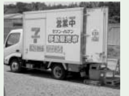
仮設住宅近くに来た移動販売車