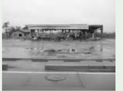
コンビニの跡形もなく...