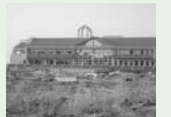
海岸近くの中浜小学校(2階上部まで浸水)