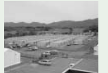
体育館横仮設住宅(140棟)