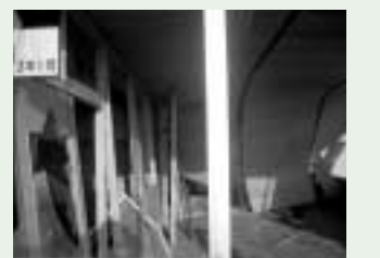
学校内1階廊下(天井がめくれている)