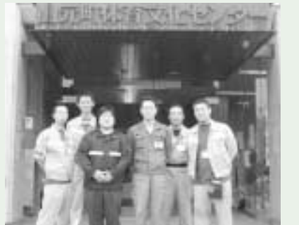
一緒に働いた仲間(中2人が山元町職員)