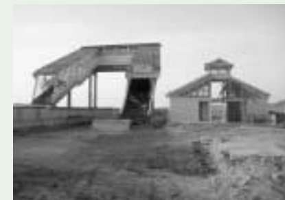
海岸近くの山下駅(駅舎もレールも流出)