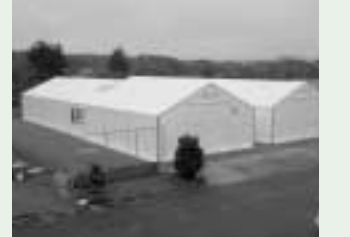
屋外テント内の支援物資(家電品・衣料品)