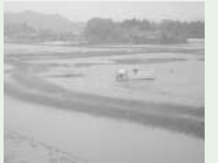
被災後まだひかない海水(名取地区)