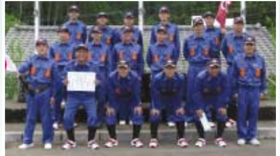
積載車操法の部 優勝 南郷分団 本部