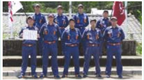
ポンプ車操法の部 優勝 北郷分団 本部

以上の部及び積載車操法の部で西郷分団第2部(西郷分団1位)と北郷分団第4部(北郷分団1位)は、8月6日(土)に開催される日向支部消防操法大会に出場します。ご健闘をお祈りします。