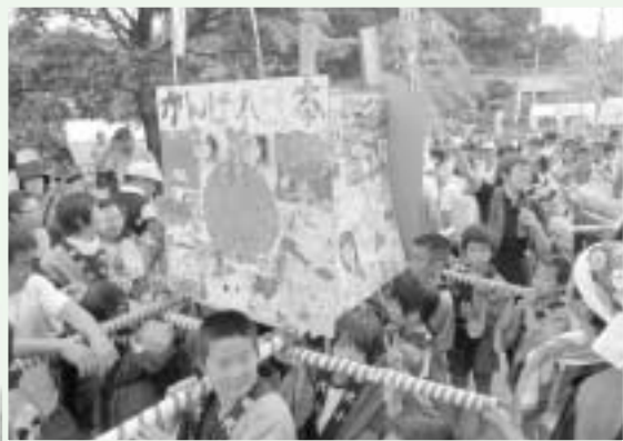
趣向を凝らした子ども神輿