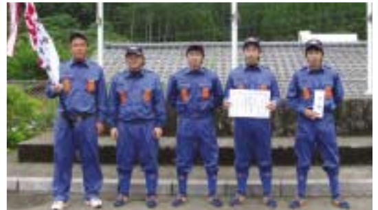
小型ポンプ操法の部 優勝 南郷分団 第3部