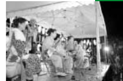
迫力のあるいだごろたな