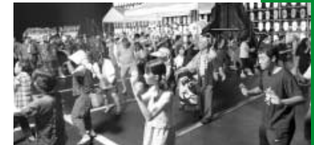
最後にみんなで盛り上がりしました