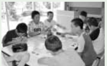
力作が完成したガラス工芸