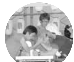
青年団アームレスリング大会