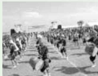
全沖縄子どもエイサーまつりの様子