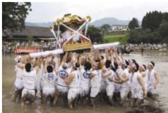
準特選 「神田のみこし」