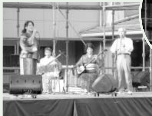
地域に伝わる民謡を披露