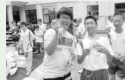
美郷南学園での交流