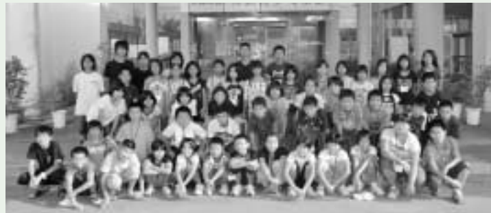
豊見城市の子どもたちと集合写真

今回の交流で23回目となったこの事業ですが、改めて姉妹都市の絆を確認しあいましたので、今後の交流の益々の発展が期待できます。