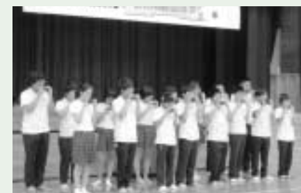
林川中学校生徒によるオカリナの披露