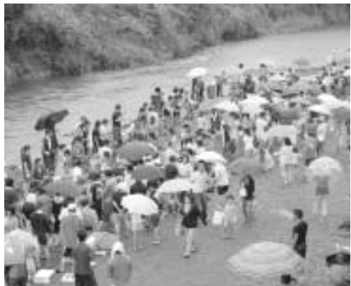
魚釣り・つかみ取り会場の様子 たくさんの人で賑わいました

他にも、南郷区ではすっかり恒例となったカラオケ大会やお楽しみ抽選会などもあり、多くの来場者で賑わいました。