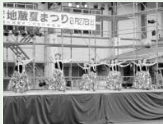
会場に華を添えました