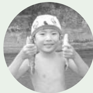
ほら見て、やったよ!

今年、「希望」というテーマのもと開催され、訪れた皆さんに元気を与えられた夏祭りとなりました。