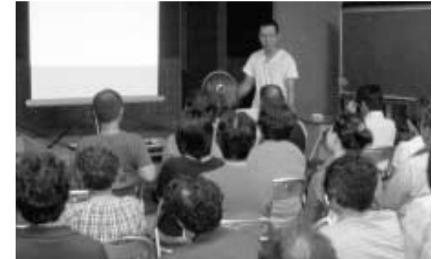
小田先生からのお話し “みなさん元気ですか↑”