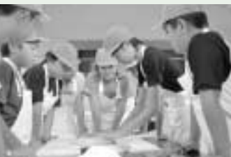
初めての経験でも良いそばが打てました