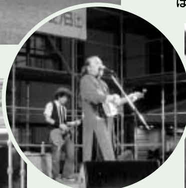
日出克ライブ「琉球の調」が心に響きます