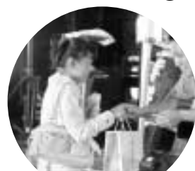
抽選会も盛り上がりしました