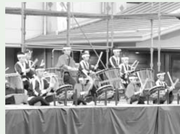
魅せます 日向太鼓「天地鼓響」