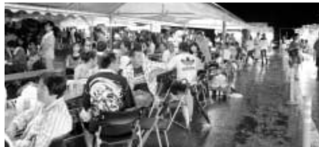
雨の中多くの来場者で賑わいました