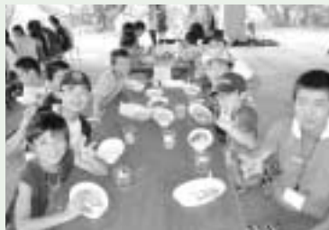
沖縄での交流の様子