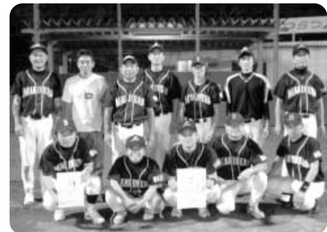
優勝：和田マリナーズ