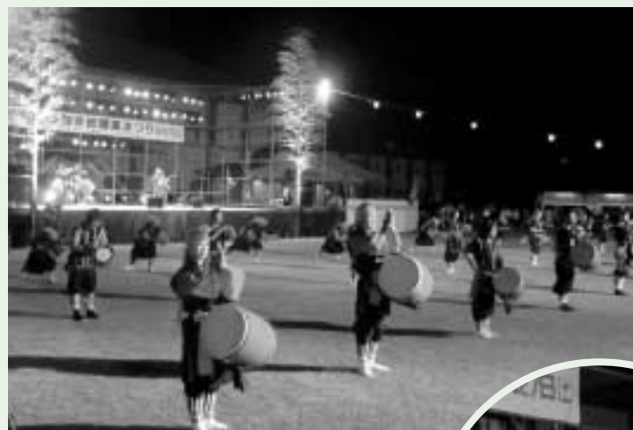
祭りのクライマックス エイサー総踊り