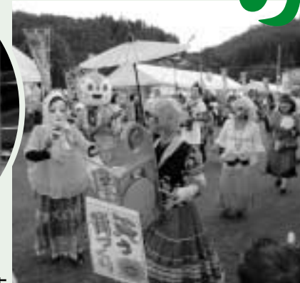
笑いの渦が巻き起こる