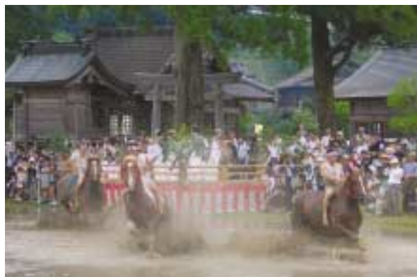
特選 「神楽奉納と馬入れ」