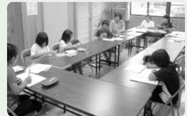
くろぎキッズ学園(初日)

放課後子ども教室は、学校の放課後の空き教室等を利用して、放課後における子どもたちの安全な活動拠点(居場所)を確保し様々な体験や学習活動を行なうものです。