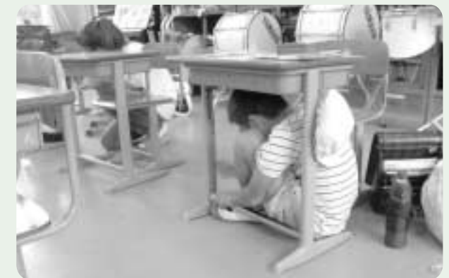
地蔵の里キッズ学園(防災学習)