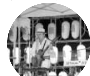
アンデス民族音楽「intil」