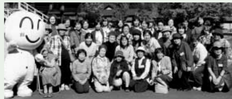
どんタロしゃんと記念撮影