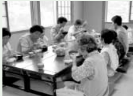
ミニ商店街での食事の様子