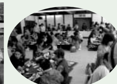
バイキングの様子