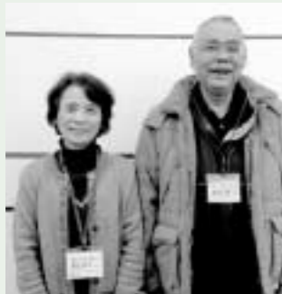
訪問者の長廣夫妻