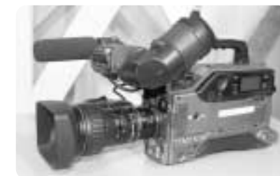
ケーブルで拓く美郷の未来!!

※各学校PTAのみなさん、婦人会のみなさん、老人クラブのみなさんなどなたでも結構です。 たくさんのご応募お待ちしております。なお、応募された方を対象にカメラ撮影の基礎研修を予定しています。 詳しくは、北郷支所 企画情報課 62-6201 までお問い合わせください。