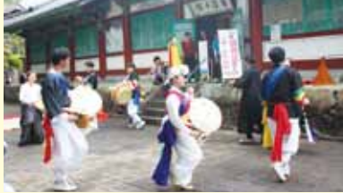
地域の方とのサムルノリ交流

今回は初めて百済の館前の国道388号を歩行者天国とし、美郷町と高鍋町の2団体による百済王伝説にまつわる舞踊や在日コリアンのサムルノリチーム「パルトカンサン」の演奏や交流、韓国遊びや韓国料理教室など、韓国＝百済の里のイメージにあった多数の催しで盛り上がりを見せました。