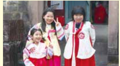
チマチョゴリかわいいね♥