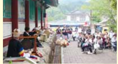
素敵な演奏演舞で会場を盛り上げました♪