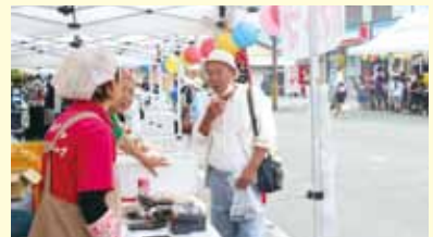
美郷グルメ市も盛況でした