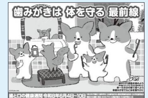
ポスター画像出典：日本歯磨工業会等

健やかな生活のための一生のつきあいとなる歯ですが、 乳幼児期から高齢期まで、それぞれのライフステージにあ った、自身でできる日々の歯みがき習慣(セルフケア)と、 定期的な歯科受診(プロフェッショナルケア)が必要です。 この期間に2つのケアを見つめなおし、歯の健康寿命を延 ばしていきましょう。