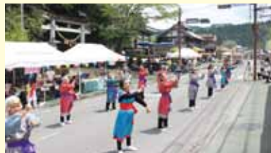
百済王伝説にまつわる舞踊