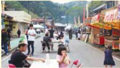
国道沿いに露店もたくさん!