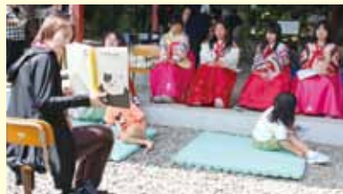
韓国絵本の読み聞かせ