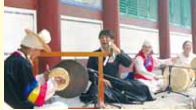
在日コリアンのサムルノリチームのパルトカンサンの皆様