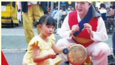
来場客もサムルノリ体験♪