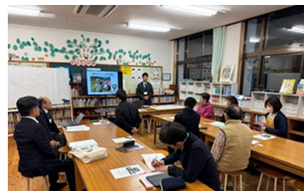
【学校運営協議会（地域学校協働活動推進員参加）】