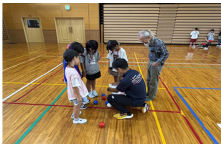
【スポーツ体験・ボッチャ】