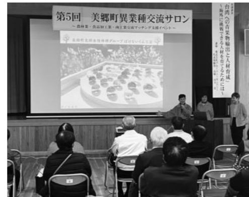
ぼけない君工房の成果発表