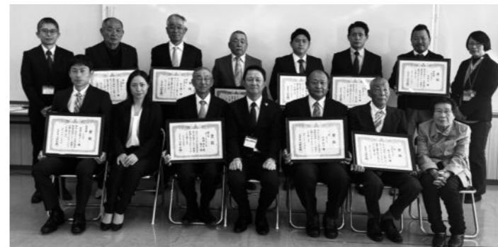
振興局での集合写真