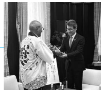
知事へ「いすゞ美人」贈呈