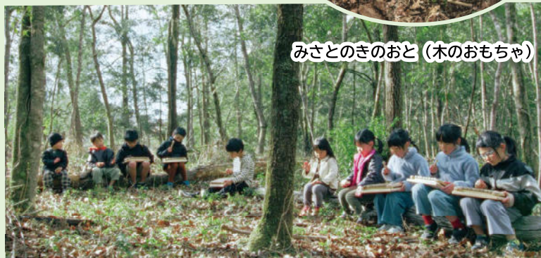
動画のオープニング