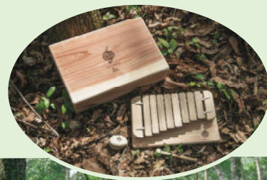
みさとのきのおと(木のおもちゃ)