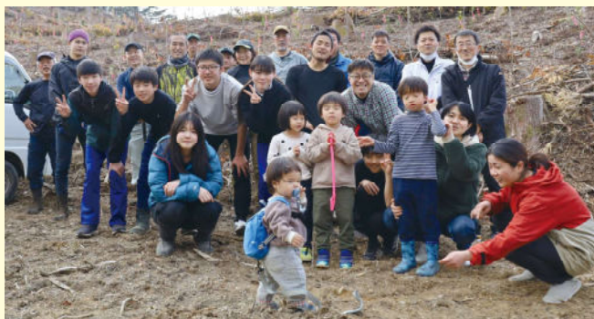
もりをふやそうの参加者