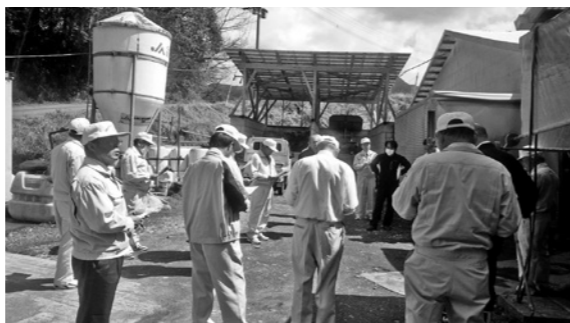
牛舎給水施設改修(南郷地区)