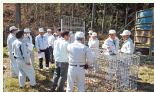
定例会現地調査(猿捕獲大型囲い罟/西郷下八峡地区)