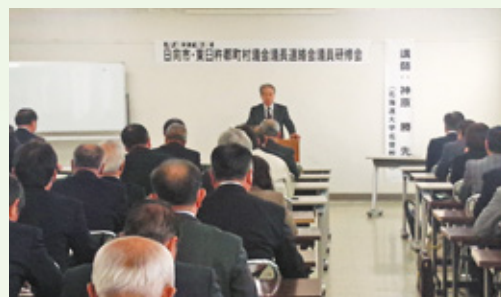
日向市・東臼杵郡町村議会議長連絡会議員研修会