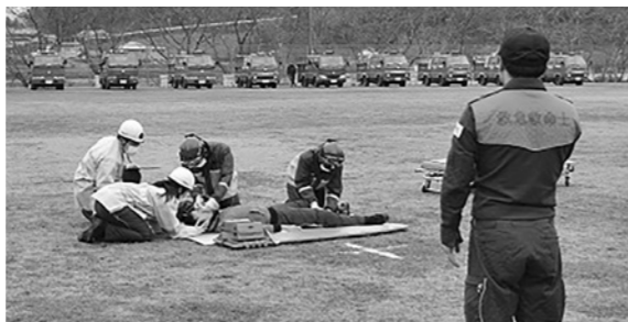
救急救命士活動の様子 (消防出初式での救急デモンストレーション)