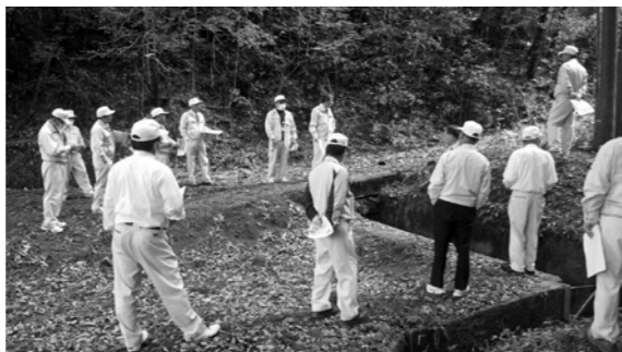
中山間地域総合整備事業(南郷黒岩地区排水路)