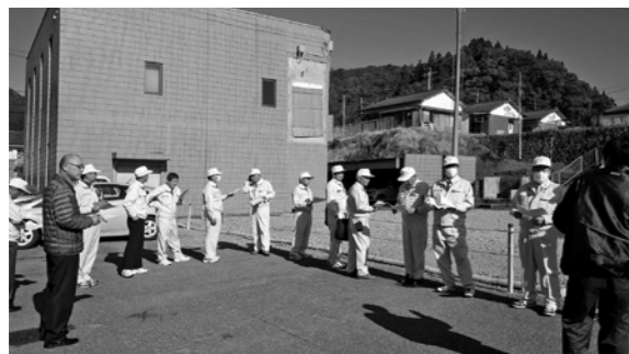
新庁舎建設予定地