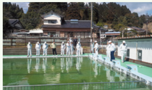
定例会現地調査(美郷南学園プール)