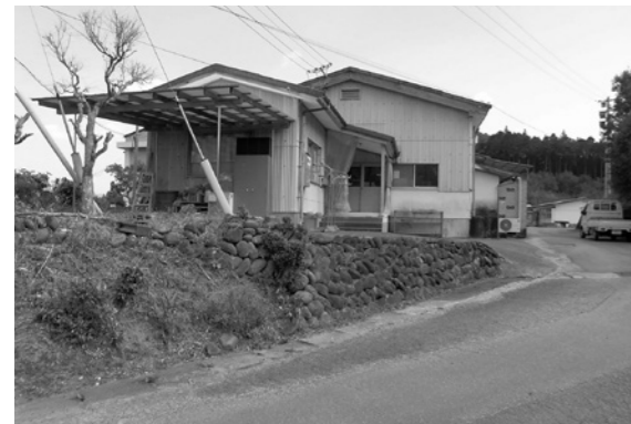
西郷給食センター