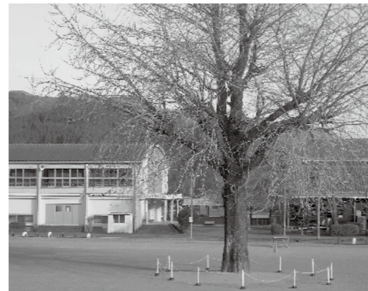
田代小学校 イチョウの木

【答】(教育長) 樹木医等の診断を受け、土壌の改良を行う等対処した。今後とも注意深く観察を続け天然記念物の保護に努める。