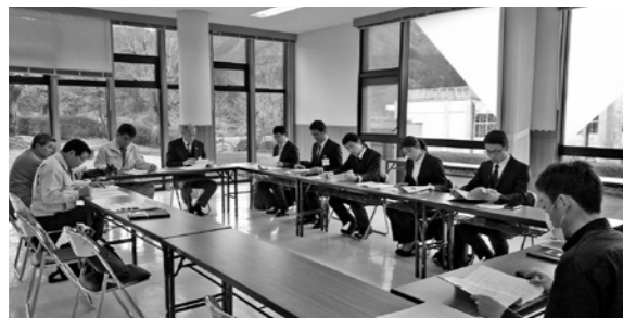
救急救命士との意見交換会