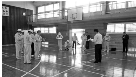
西郷中学校体育館