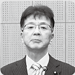
わかすぎ しんじ 若杉 伸児 議員

町長 高齢者比率が高いということは、知恵と経験に溢れた町であると言える。攻めと守りをバランスよく考え、これまで地域を支えてくださった方々が100歳でも元気に暮らせる町づくり、美郷に暮らして良かったと思える地域を創っていきたい。