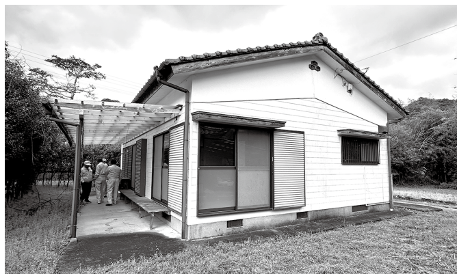
北郷地区 教職員住宅の現在の様子（令和8年度に2戸解体されて、新しく建築されます。）