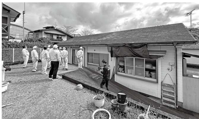
神門中公民館 屋根修繕予定