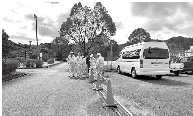
南郷運動広場駐車場 排水改修工事予定