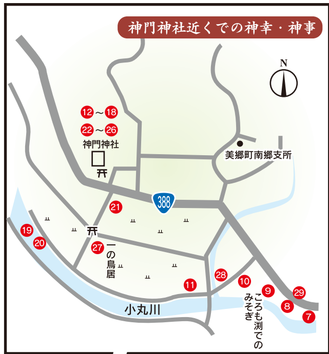
神門神社近くでの神幸・神事